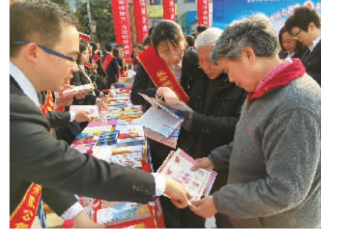
常年坚持向消费者发放反假币、防范电信诈骗、银行卡信息安全等资料,广泛普及金融知识,提升受众群体自我保护意识。

对银行而言,守牢管理风险和信贷风险底线,保障安全稳健运营是安身立命之本。开业前6年,分行始终保持资产零不良,近4年坚持将资产不良率控制在0.8%以内,高质量发展基础得到持续夯实。 严守信贷风险底线。 牢固树立“信贷成败决定经营成败”理念,多措并举、多路并进全力做好风险贷款压降工作,全面提升风险管理水平及综合研判能力,综合协调监管与市场、发展与风险、效益与成本的关系,长远布局,统筹推进。一是坚持风险为本,持续完善“全面、全程、全员”的风险管理体系建设。为适应金融监管要求,长安银行安康分行精耕细作,持续增强风险处置应对的系统性、整体性、协同性,从顶层加强管理架构的监管责任和管理责任设计,构筑“全机构联动、全员参与”的风险管理防线。二是充分发挥信贷审查委员会作用,把牢入口关,通过风险例会、风险管理委员会等专题会议,下达任务、压实责任,传导风险贷款灵活处理的理念。坚持按月开展到期贷款风险情况排查,锁定重点潜在风险贷款客户,做到心中有数,提前研判。三是建立有效的考核约束与激励机制,实行业务条线部门及支行目标任务双向考核。出台《风险贷款处置化解奖励办法》,区别业务体量与风险分布情况,差异化配备专项激励费用,有效调动全辖范围内信用风险防控工作的积极性。四是针对重点风险贷款,有效甄别,精准施策,一盯到底,持续给力,不断提高处置效率。通过多维度多层次效能治理,护航高质量发展,为风险贷款的化解赢得了充分的时间。近年来,累计清收化解风险贷款5.1亿元。 筑牢管理风险藩篱。 一是充分发挥制度保障作用,持续推进风