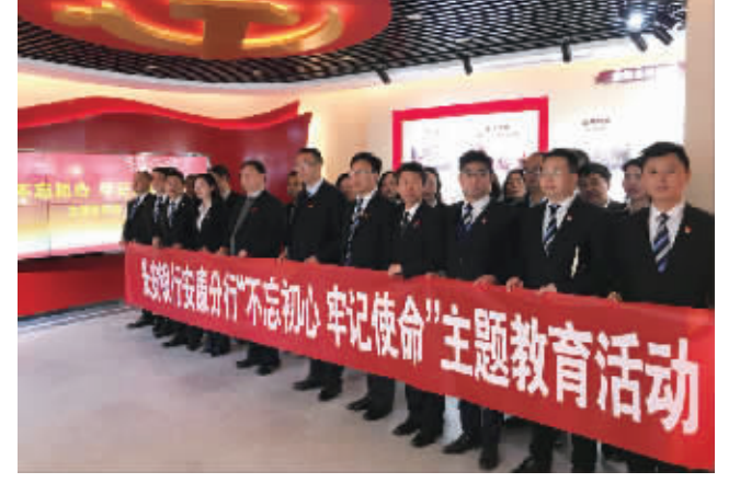
巩固深化“不忘初心、牢记使命”主题教育,夯实党的建设这个“根”和“魂”,不断锻造新时代国有企业发展新优势。

10年的发展实践,长安银行安康分行始终坚持“以党建引领为核心全面筑牢发展根基,以人才队伍建设为支撑全力打造核心优势,以企业文化建设为中心全面激发内生动力”,统筹推进内部管理与业务发展。“三大战略”的精心构建和协同发展,开创了当前政治生态清明、业务发展稳健、干部队伍战斗力强、内部管理持续精细,社会形象日益提升的良好局面,有效增强了安康分行综合竞争力,为高质量发展之路行稳致远提供了强有力支撑。 党建引领是根本。 坚持党的领导、加强党的建设,是国有企业的“根”和“魂”。长安银行安康分行始终把党的建设作为经营发展的最强支撑、最大优势和关键力量,坚持以习近平新时代中国特色社会主义思想为指导,坚持守正创新,党建向强、经营向优的互促双赢,实现了党建引领业务发展、业务促进党建的良性互动,走出了一条高质量党建引领高质量发展之路。系统内多次被评为党建及党风廉政建设先进单位及先进集体,党委班子连续四年被总行党委授予“优秀党委领导班子”荣誉称号,2018年更是被省国资委授予“优秀基层党组织”荣誉称号。 人才队伍是核心。 环境好,则人才聚、事业兴。十年来,安康分行始终坚持以人为本,多措并举打好人才培养“组合拳”,持续激活人才“第一资源”,最大限度释放人才红利,擎起发展动能,奠定了安康分行高质量发展最核心优势。一是优化成长环境,栽好“梧桐树”。坚持打造“成长成才有平台,锻炼磨练有舞台,创先争优有擂台”的内部发展环境,培养和吸引了一大批优秀人才,为安康分行发展融入了多元文化,凝聚了智慧和力量。员工数量从开业之初的29人发展到目前近200人。二是严格选人用人,念好“人才经”。牢