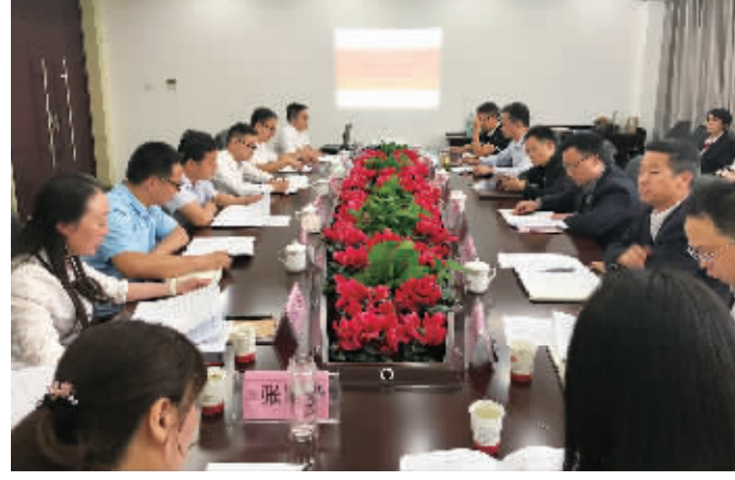
精准施策,打通、压实资金供给侧“需求端”和“服务端”,以服务“六稳六保”为重点,不断提升金融资源配置与经济社会高质量发展的契合度。长安银行安康分行与安康中心城市投资建设开发有限公司签订《全面战略合作协议》,续写合作新篇章。

肩负着深化地方金融体制改革的希望和期望,长安银行安康分行自成立之初,便牢牢树立了“立足地方服务地方”的发展定位。10年来,安康分行紧紧围绕中省市战略决策部署,以壮大地方金融力量为己任,以服务地方经济社会发展为目标,以独到的发展战略眼光,精准的市场定位,灵活的经营方式,在区域市场中精耕细作,在差异化服务中运筹帷幄。在与安康经济社会发展同频共振中打造安康分行高质量发展新引擎,顺利实现了从支持地方经济发展“生力军”到“主力军”的完美蜕变。 支持重大工程建设。 聚焦主责主业,主动作为,积极投身陕西“追赶超越”发展浪潮,围绕安康市委、市政府中心工作,培育和积蓄发展优势,先后重点支持了陕南移民搬迁、棚户区改造、脱贫攻坚、乡村振兴等国家重大战略项目。10年来累计投放各类重大工程建设资金57亿元,在服务陕西“追赶超越”发展战略中做出积极贡献。 支持重点项目推进。 紧跟市委、市政府“追赶超越、绿色崛起”工作布局,深化政、银、企战略合作,充分发挥信贷资金“撬动”作用,努力打造创新发展增长极。先后投放30亿元信贷资金用于支持医疗卫生、教育、交通、现代物流、现代农业、全域旅游等多个领域,在金融支持民生工程、绿色循环产业发展、城乡统筹等重点项目工作中做出了重要贡献。