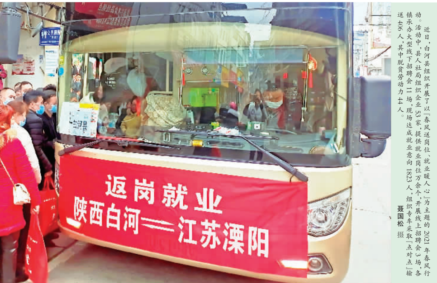
近日，白河县组织开展了以“春风送岗位、就业暖人心”为主题的“2021年春风行动”活动，县人社局组织企业、提供就业岗位万余个，开展线上招聘会，各镇承办大型线下招聘会2场，现场达成就业意向2000余人，组织专车采取“点对点”输送700人，其中脱贫劳动力200人。