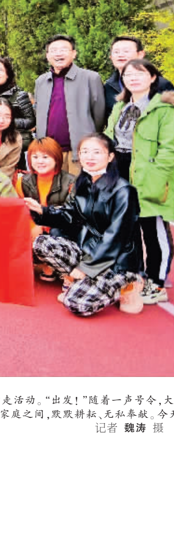
“出发!”随着一声号令,大家迈着矫健的步伐,沿着汉江边人行步道向东坝大桥进发,在行走中感受春日的美好和运动的魅力。平时,她们活跃在编采一线,奔波在事业与家庭之间,默默耕耘,无私奉献。今天,她们从忙碌的工作岗位中走出来,享受着节日和活动的愉悦。

业建设,全面推行林长制,严格管控森林资源,做好巩固脱贫成效与乡村振兴的有效衔接,推动全县林业工作向纵深发展。 “我们要加快发展林业经济,做大做强白河木瓜、茶叶、核桃、林下经济,加大森林资源的有效保护,落实生态修复和生态保护工程,让白河的山更青、水更绿、天更蓝、空气更新鲜,让全县林业工作上一个新台阶。”白河县林业局局长阮家顺说。