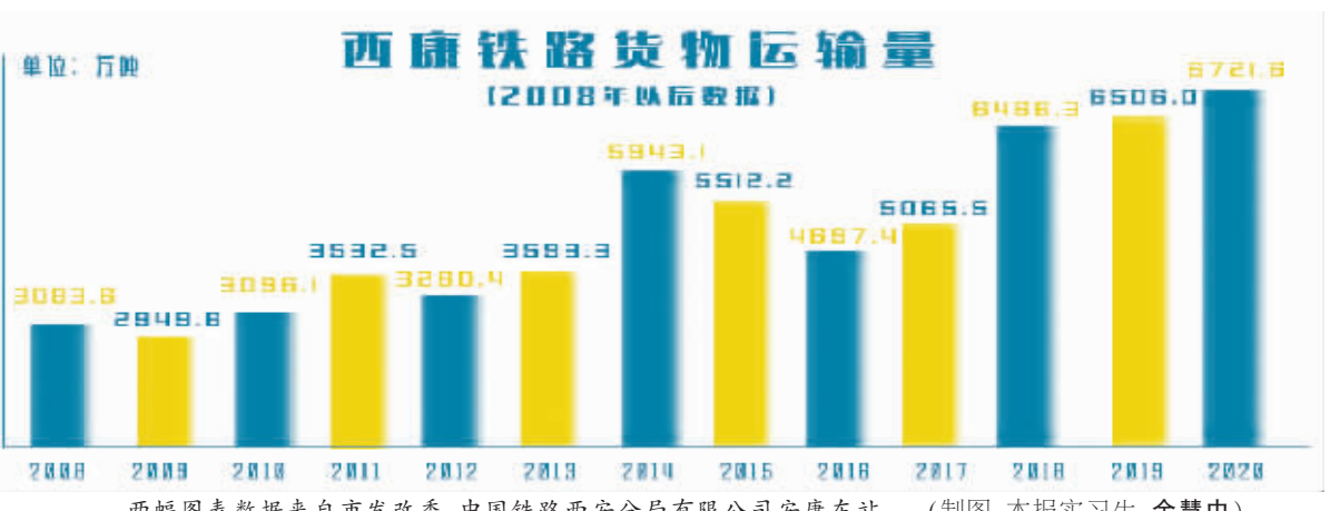
两幅图表数据来自市发改委、中国铁路西安分局有限公司安康东站。(制图:本报实习生 余慧中)