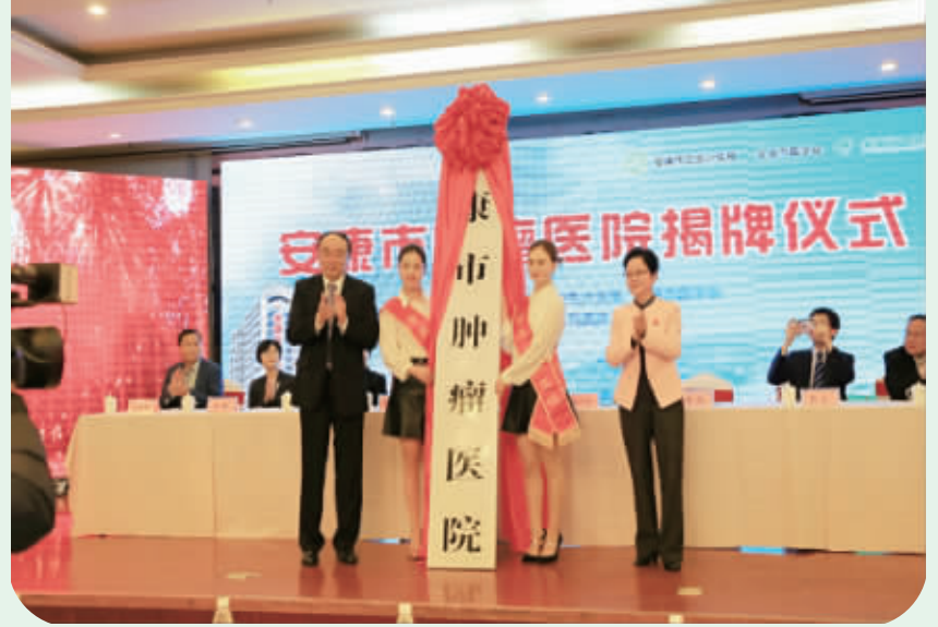
“安康市肿瘤医院”揭牌仪式