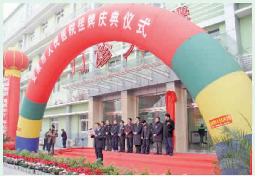
2005年安康铁路分局中心医院易名为“安康市人民医院”