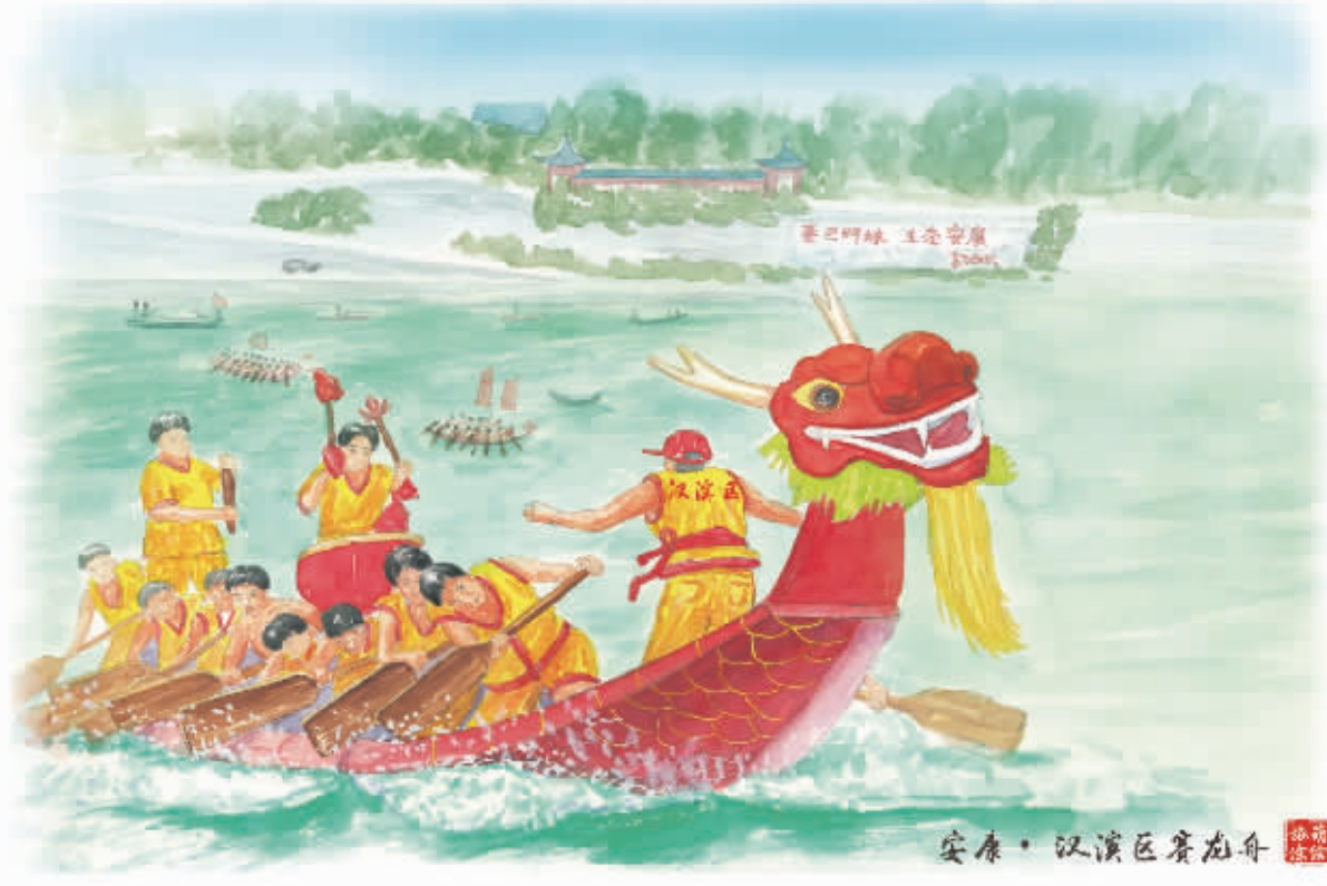
安康·汉滨区赛龙舟