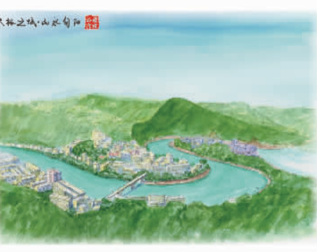
大巴之城·山水旬阳