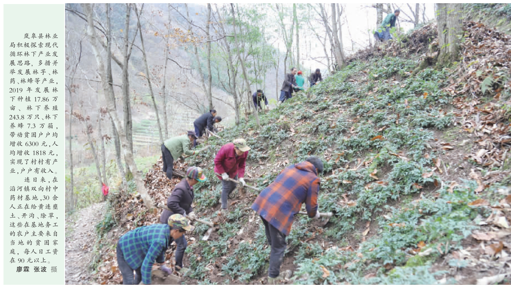
岚皋县林业局积极探索现代循环林下产业发展思路,多措并举发展林下种植、林下养殖、林下养蜂等产业,2019年发展林下种植17.86万亩、林下养殖243.8万只、林下养蜂7.3万箱,带动贫困户人均增收6300元,人均增收1818元,实现了村村有产业,户户有收入。 连日来,在滔河镇双向村中药材基地,30余人正在给黄莲壅土、开沟、除草,这些在基地务工的农户主要来自当地的贫困家庭,每人日工资在90元以上。

廉政防线,针对扶贫领域易发违纪问题的情况,结合纪律教育学习宣传月活动,各镇党委委员分别到所驻村讲廉政党课,并组织与会人员集中学习扶贫领域的典型案例,同时结合典型案例,剖析违纪原因、总结警示教育,引导驻村四支队伍以案为鉴,警钟长鸣,做到心中有纪律、行动有底线;高举惩治利剑,保持高压态势,始终把解决扶贫领域腐败和作风问题作为重中之重,紧盯脱贫攻坚重点环节、重点区域、见人、见事常态化开展督导检查,摸工作进度、摸资金落实、摸工作作风、排查问题线索,着力把问题找准。截至目前,共开展扶贫领域及作风建设的督导检查8余次,下发督查通报6期,查处扶贫领域问题线索4起,处分4人。