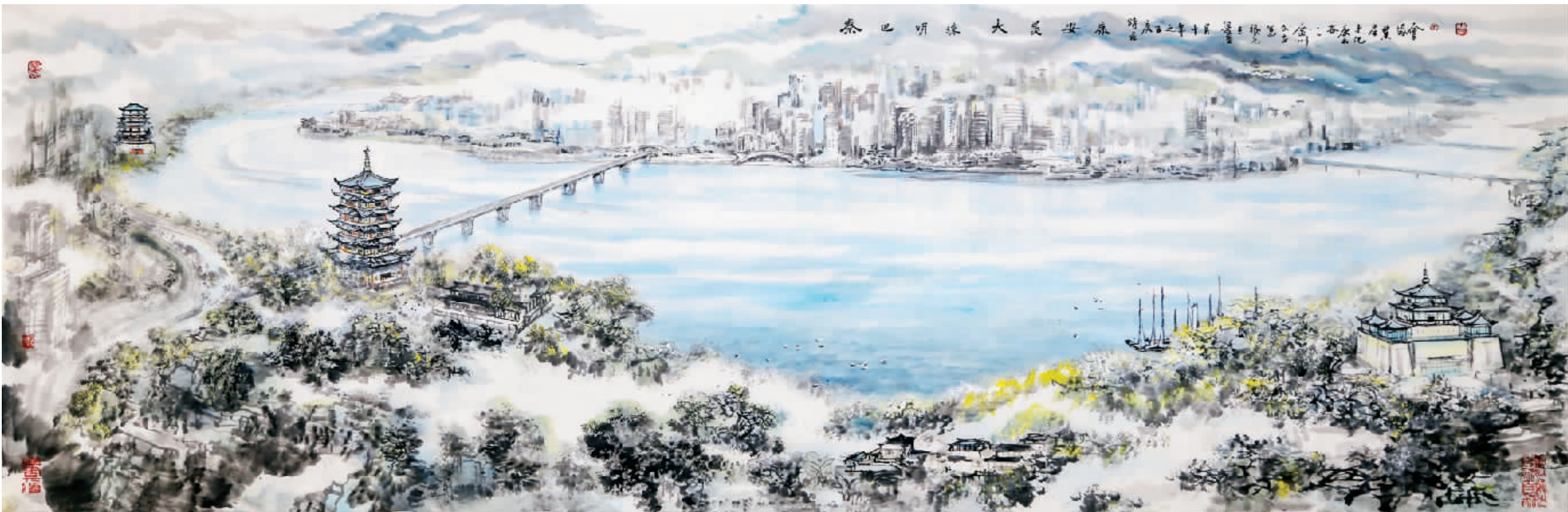
秦巴明珠 大美安康