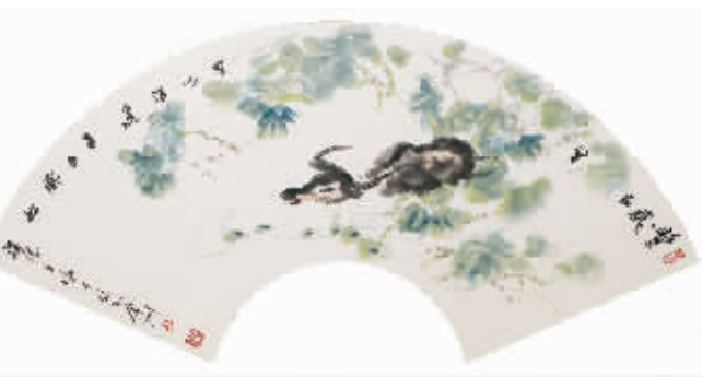
丰岁在望可以逍遥