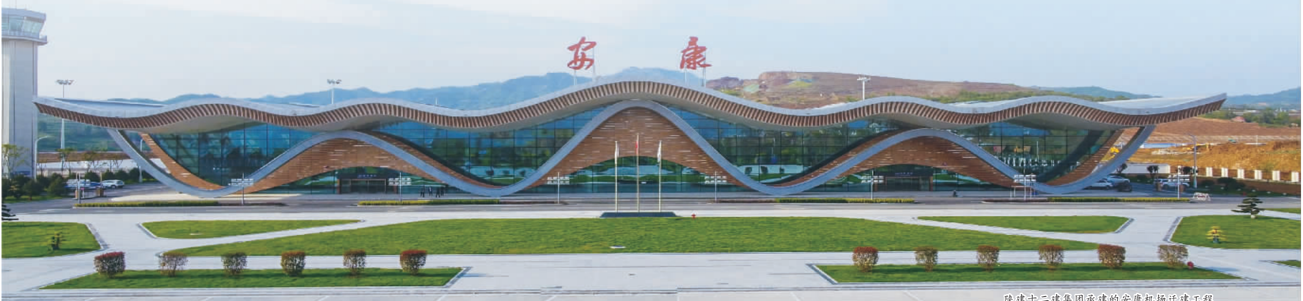
陕西建工第十二集团承建的安康机场迁建工程