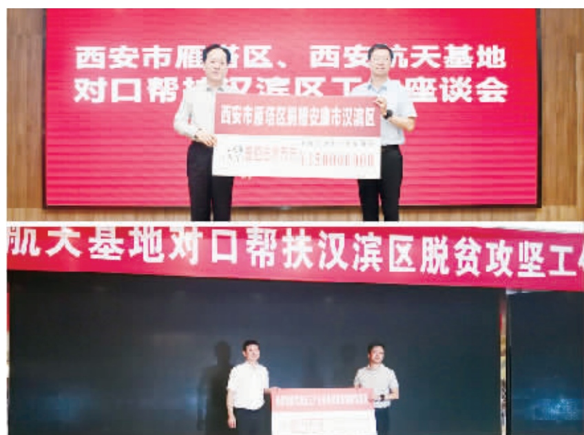
捐赠帮扶资金,助力汉滨脱贫攻坚