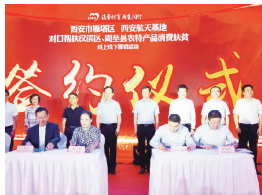
广泛动员社会力量,共同参与脱贫攻坚