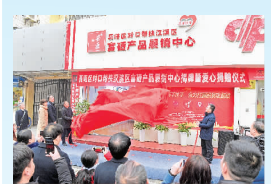
汉滨区富硒产品展销中心落地雁塔区