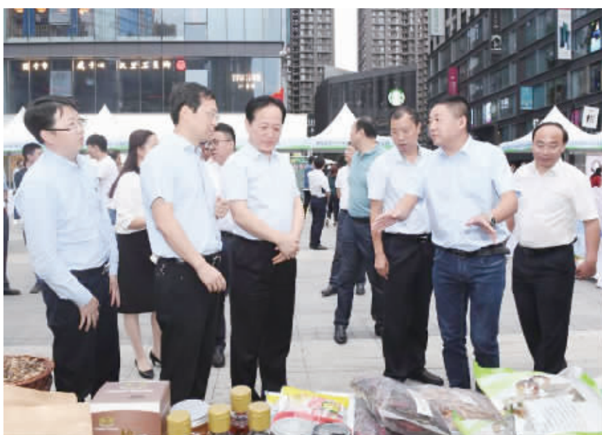
开展宣传展销活动,推介汉滨特产进西安