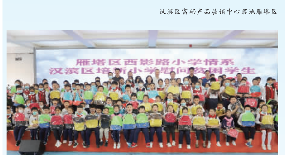
积极开展互学互访互助,为孩子们创造美好明天