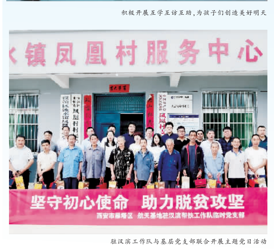
坚守初心使命 助力脱贫攻坚

全面建成小康社会,最艰巨的任务是脱贫攻坚。作为对口帮扶单位,西安市雁塔区和西安航天基地