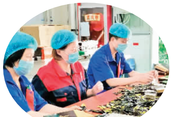
茶企生产车间工人在对速溶茶产品进行最后包装