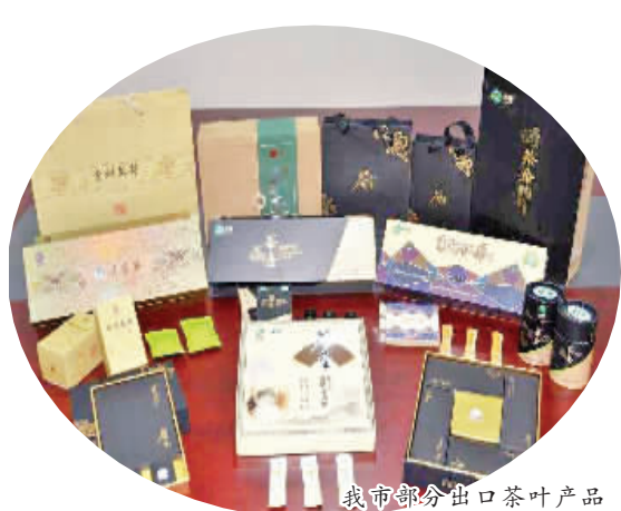
我市部分出口茶叶产品