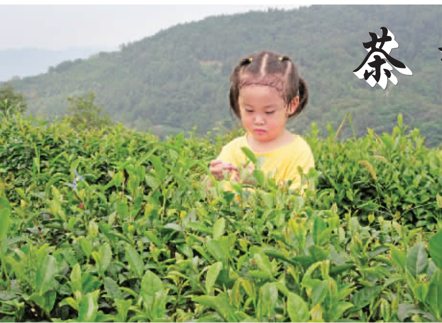
茶园小仙子

午餐是大家期待很久的豆腐宴,是刚刚搬入新社区的一家人开的,坐在桌上大家再一次齐齐惊叹,这一次我顾不上吃了,用相机抢下那些美轮美奂的豆腐花朵。美好的食物总是让人感到纯净与温暖,她似妈妈的味道让我一再放慢前行的脚步,这一次在茨沟我知道我已找寻到心灵的憩园,可以悄悄地埋葬那些凡尘杂念,整个人变得单纯起来悠然起来。