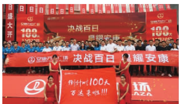
●营销中心地址:安康市高新区秦岭大道与万达路交汇处(安康运动公园西南侧) ●电话:3431111

一个中心商圈,不仅仅是品牌与人潮的汇集枢纽,更是周边资产增值的强力引擎。开业之后,万达国际SOHO公寓、万达中心loft公寓、中心人潮铺等,将迎来一场全城艳羡的升值浪潮!