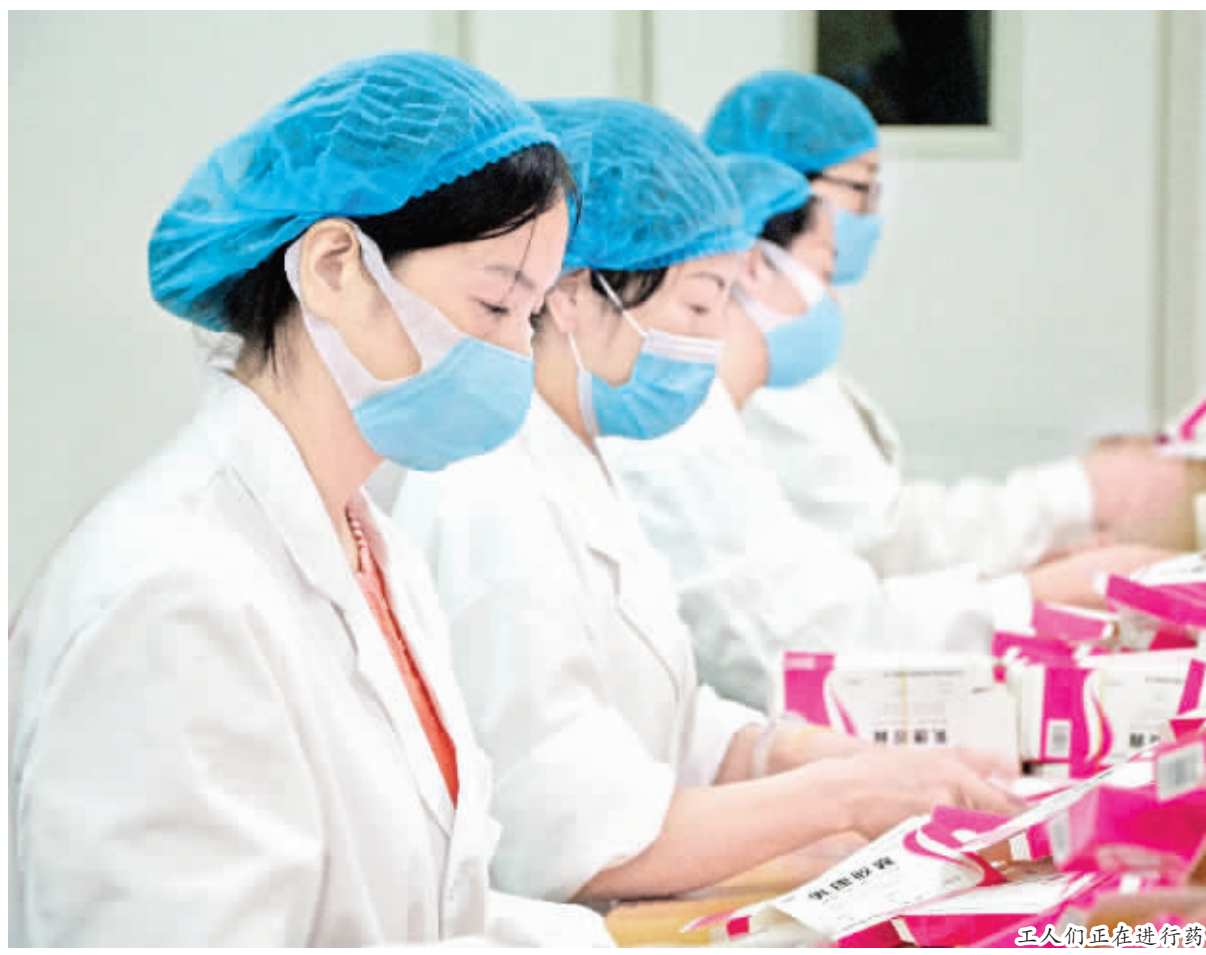
工人们正在进行药品最后的包装环节。

自复工复产以来,安康北医大制药股份有限公司加班加点提升产能,确保防疫物资供给。该公司在保证本厂职工全部到岗的前提下,新增就业岗位,解决受疫情影响失业劳动力达120余人次,并通过扩大种植基地,采取“政府+公司+基地+贫困户”的方式,带领1500余名困难群众发展产业,增收致富。