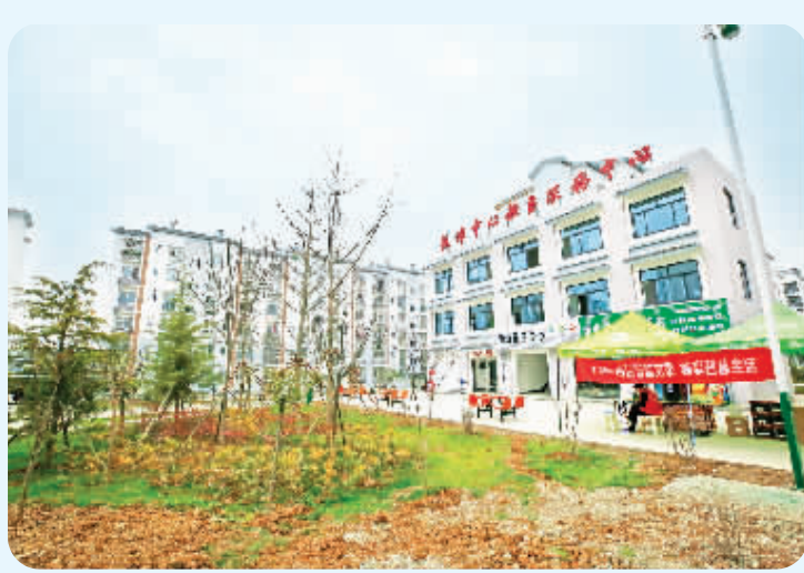
贫困户有了新家园

地处汉江南岸的汉滨区张滩镇，是距离安康中心城区距离最近的乡镇，全镇辖10个行政村，5个社区，172个村民小组，东与石梯镇、关家镇接壤，南与县河镇毗邻，西与新城相连接，北与关庙镇隔江相望，属于典型的城乡结合部。镇内旅游资源丰富，以奠安塔、大崩山、二郎庙为标志的景区景点人文底蕴丰厚，穿境而过的黄洋河与优良的生态禀赋为农业发展奠定了基础，蚕桑、林果、畜牧、养殖成为带动当地山区农户脱贫的重要手段。