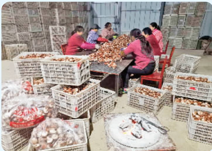
香菇产业蓬勃发展