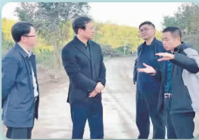
区委书记王孝成(左二)督导反馈问题整改情况