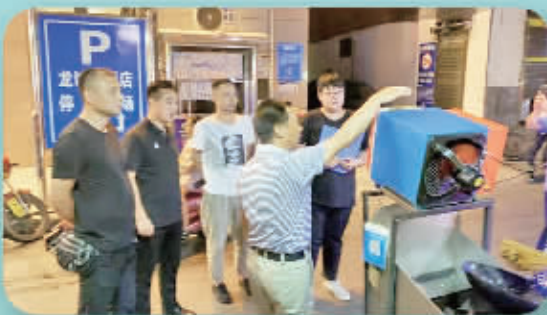
督查餐饮油烟治理