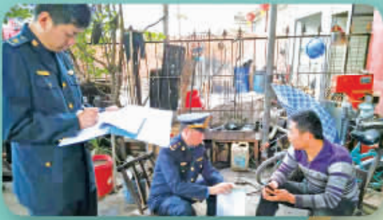
检查企业环保措施