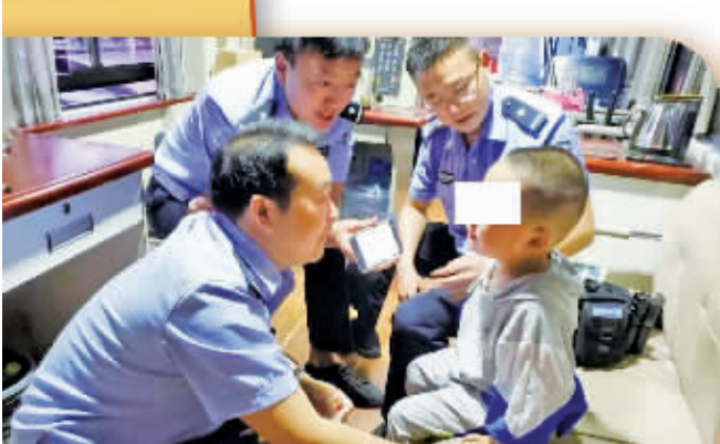
民警帮助走失儿童寻找家属