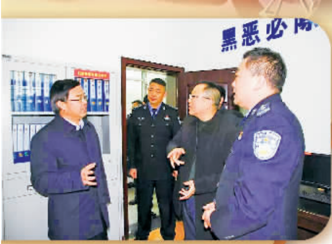
市人大常委会副主任、县委书记郭小东(左一)调研扫黑除恶专项斗争