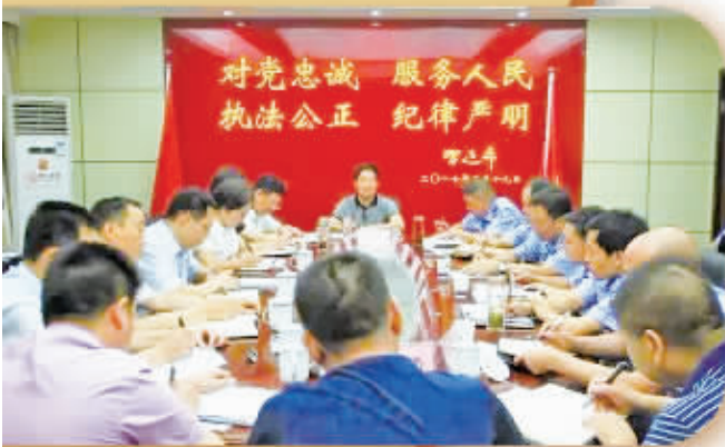
县长陈伦富(中)调研公安工作