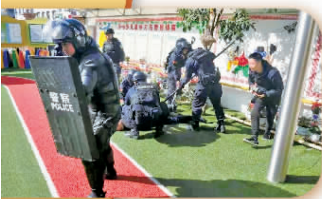
巡特警大队开展校园反恐演练