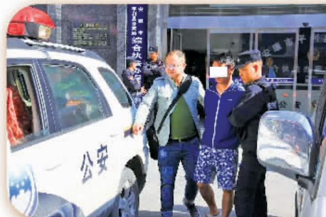
打掉本地“李某恶势力团伙”