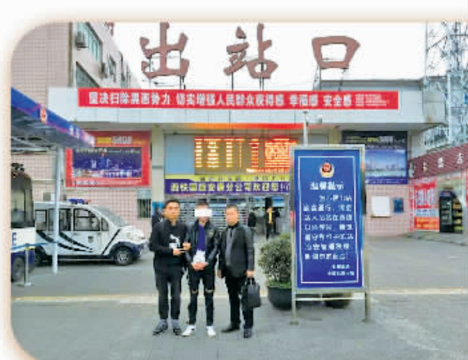
跨省抓获电信诈骗犯罪嫌疑人