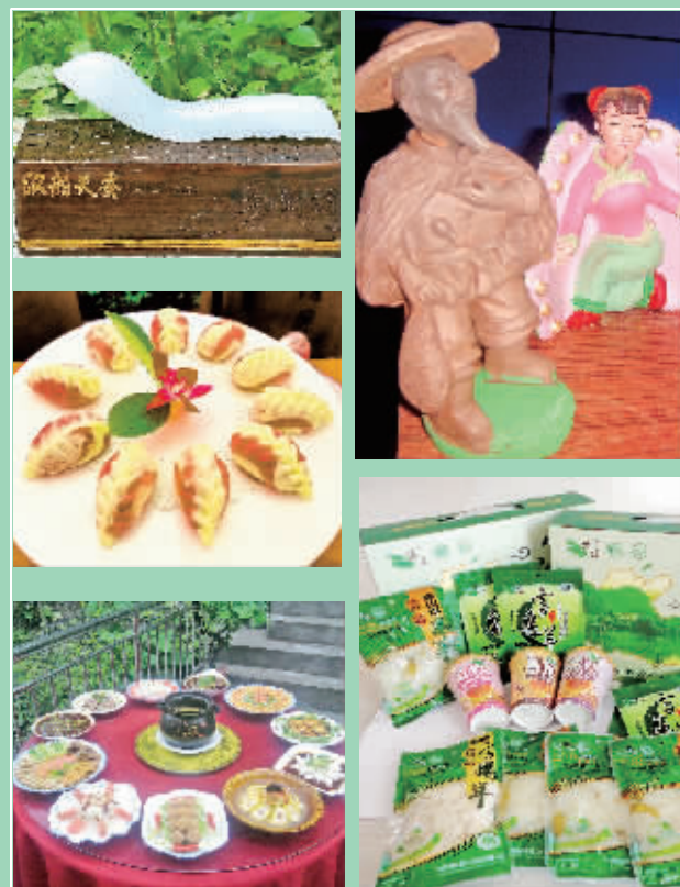
汉滨旅游产品和特色小吃