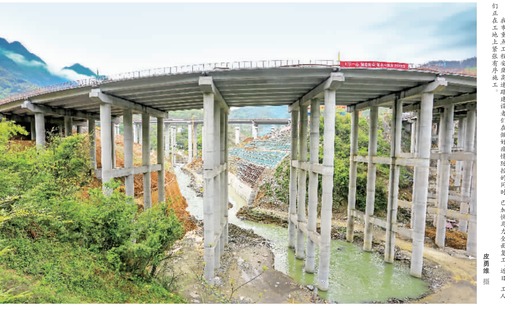
安康市重点工程安康高速公路建设者们正在工地上紧张有序施工。近日,工人们正在工地上紧张有序施工。

3.02亿元,投入资金总量为陕南之最。主动向上争取中省财政扶贫资金支持,找准争取资金的“切入点”和“着力点”,确保中省各项政策“接得好、见实效”。