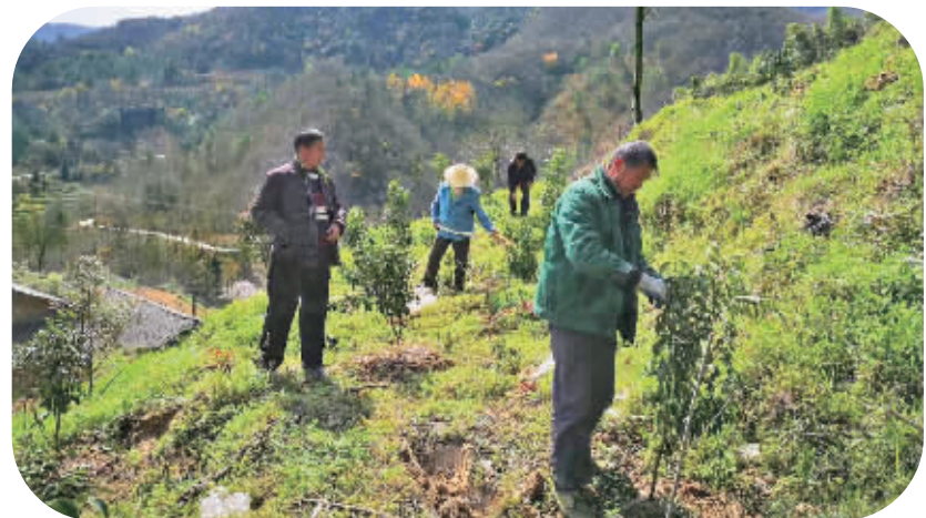
凤凰山麓，流水美景。