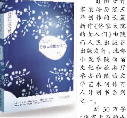
《佟家大院的女人们》