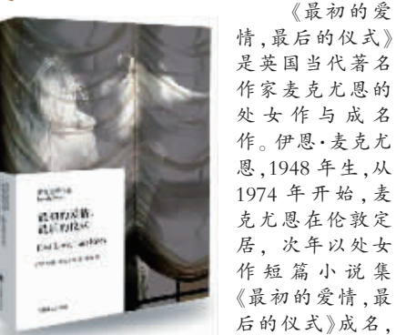
《最初的爱情，最后的仪式》