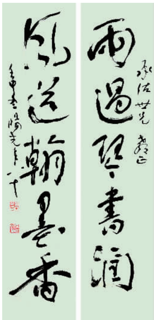
雨过琴书润 风送翰墨香 刘锡光 书

刘锡光是安康书法史上的一位里程碑式的人物，以汉隶为根基的行草书作代表了近现代安康乃至陕南书法艺术的最高水平，是安康近现代书法的“权威”。权威的产生，使我们荣耀、自豪，给我们激励。权威的产生，也易使书法的发展受到约束。我们应以崇敬而又自信的心态，避免在权威的笼罩下，望而却步或亦步亦趋。有志于书道的书家、爱好者应站在前人的肩膀上，创造出有时代气息的崭新的书法艺术作品，给人们以美的精神享受。