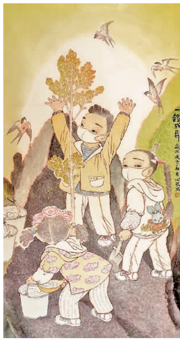
咱和小树一起长大

据不完全统计，全市文艺工作者共创各类文艺作品1000余件，学生主题文艺作品征文2000余件。截止3月23日，“文化安康”“安康融媒”已推出安康“战疫”系列文艺作品39期，其中曲艺音乐篇13期、诗歌篇13期、书画篇13期。音乐作品《有你真好》《太阳勋章》《我会回来》《守护家园》等被学习强国转载推介。