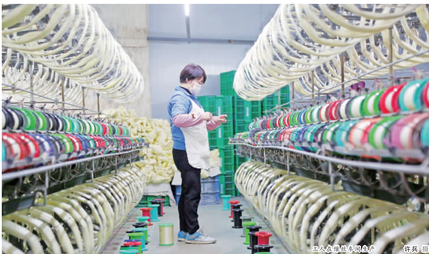
工人在缫丝车间生产