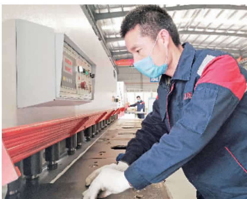
近日，普瑞达电梯有限公司在完成统一消毒防控工作后，一条电梯板材生产线正式启动。在接到复工通知后，企业立即制定“防控+生产”方案，并完成各项报备手续。

伴随着阵阵机器轰鸣声，石泉县各类企业复工复产正有序进行。至2月底，全县“五上”企业复工复产113个，22家新社区工厂陆续复工，县域经济活力正在全面恢复。