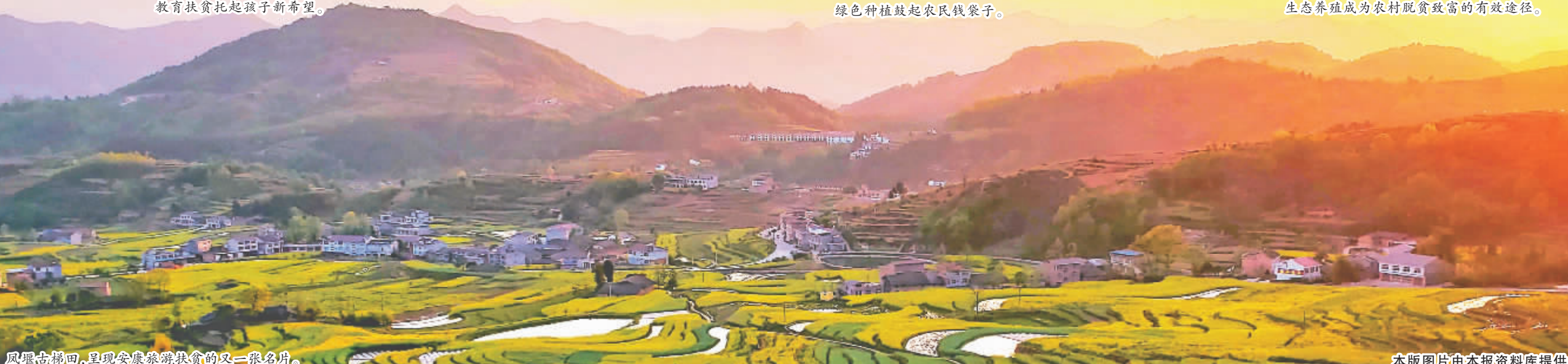
凤堰古梯田,呈现安康旅游扶贫的又一张名片。