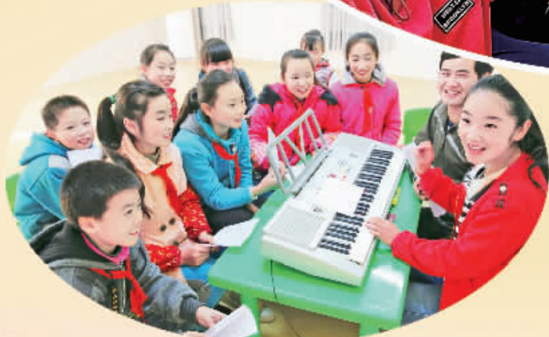
教育扶贫托起孩子新希望。