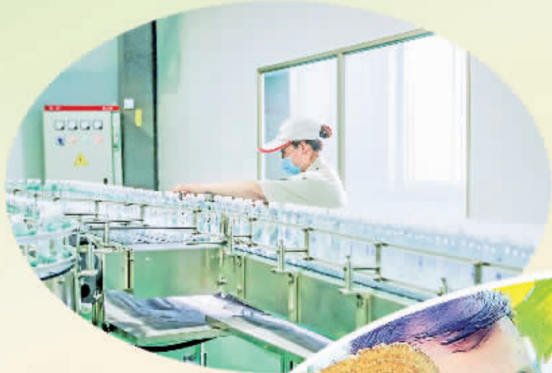
生态富硒水产业市场前景广阔。