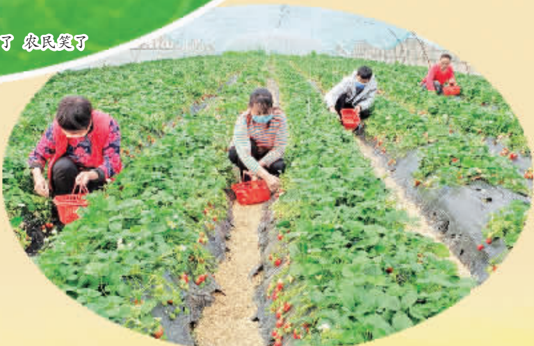
绿色种植鼓起农民钱袋子。