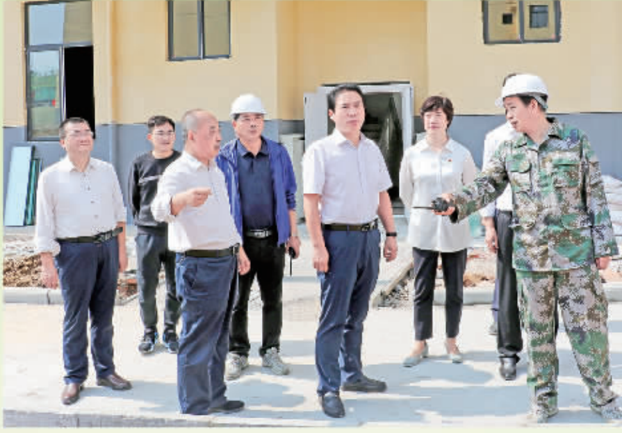
市长赵俊民赴汉滨区异地扶贫搬迁安置点施工一线检查指导工作,并了解群众搬迁入驻情况。