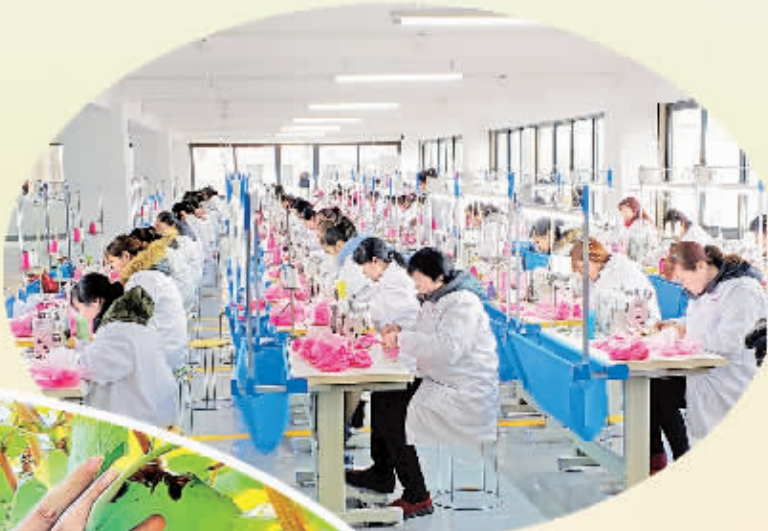
毛绒玩具厂生产红红火火。