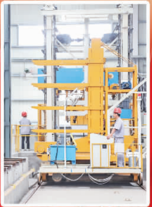
“飞地经济”蓬勃发展。