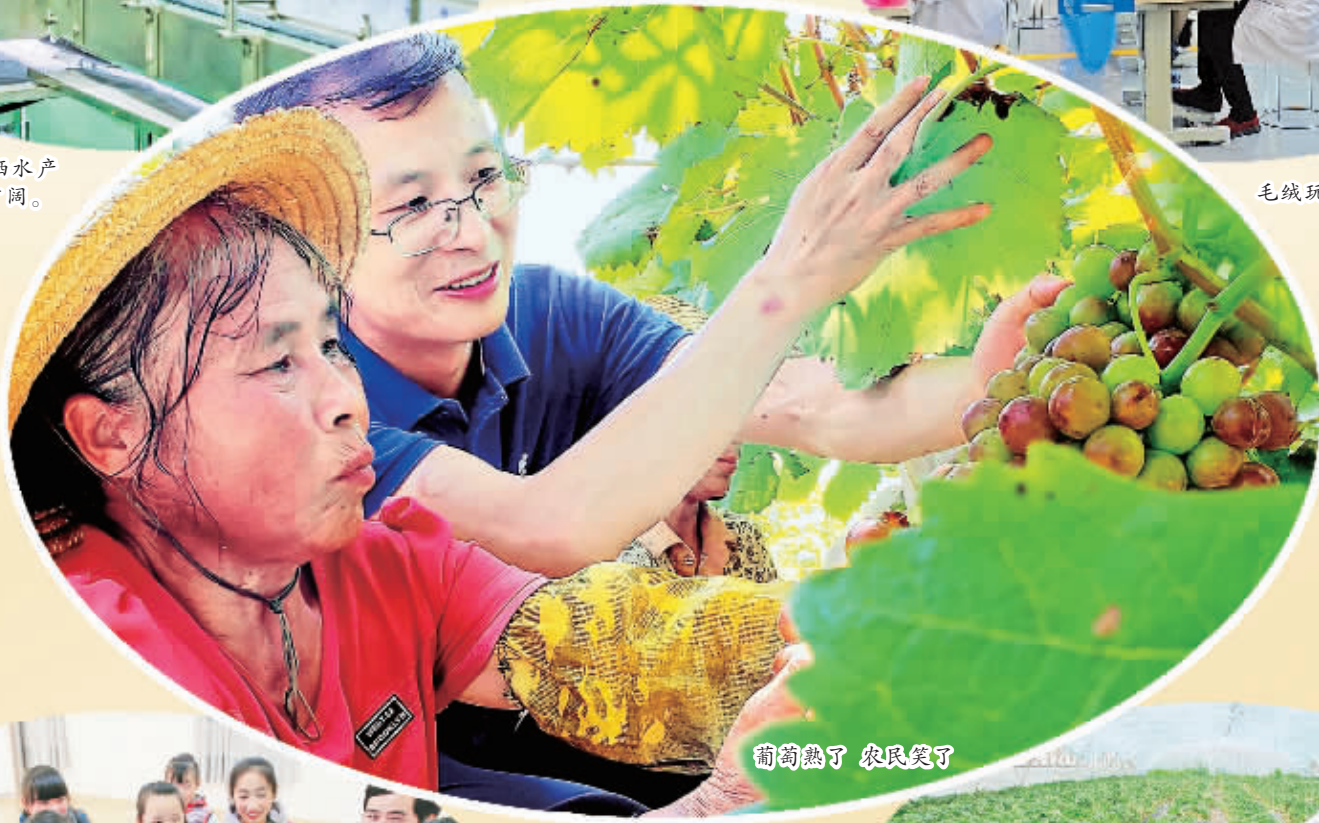
葡萄熟了 农民笑了