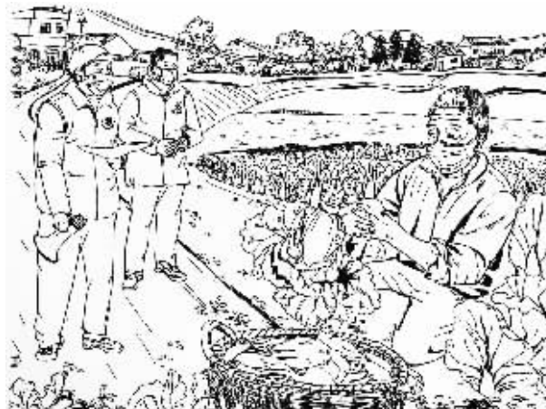
“不卖！不卖！这菜不卖！”老农一口气重复了三遍。“这菜是送给医院的！”