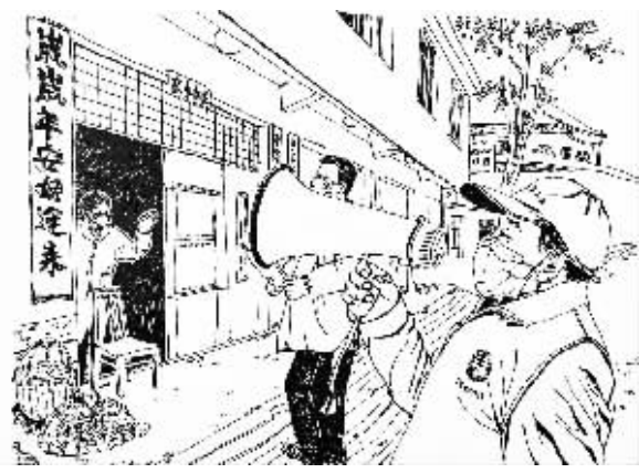
疫情期间，村干部也没有闲着，忙着在村子里宣传疫情防控知识。