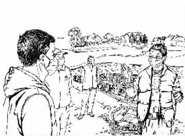
老农掰着手指头数了数：“送了第十天了！”众人不解，追问缘由。