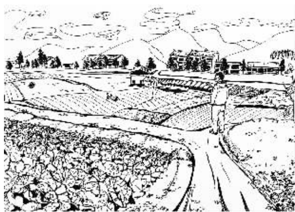
春天，陕南田园风光，格外迷人。