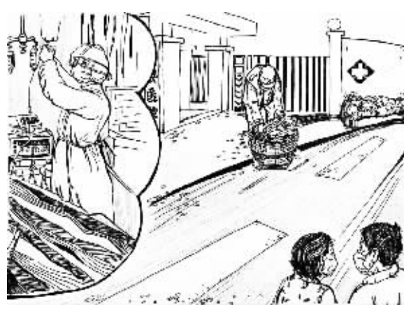
原来，他的女儿是一名护士，这些日子正在护理患者，已经十几天没有回家。老人家每天给医院送一筐青菜，让女儿和同事能吃上新鲜的蔬菜。