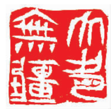
大爱无疆, 天佑中华。

一 不小心的目光和江堤上的一簇簇迎春花邂逅，柔情地盯着我，我被盯得也辉煌了，灿烂了。这一春的使者、春的恋人，悄然地在江堤上流露风采。春风挠它，它笑。蝴蝶吻它，它笑。小鸟呼它，它笑。汉江唤它，它也笑。这个春的使者呀，背着春，在江堤上笑。 二 汉江的江滩公园上，冬青和垂柳的家，安在麦冬上，安就安吧！春看这块宝地，也悄悄地和它们住在一起，春是个美容师，它轻轻地梳着柳树的辫子，梳着梳着，就把一个个干涩老发的柳树，梳顺了，梳绿了，梳美了。它给麦冬打油，打着打着，麦冬嫩了，翠了。那几株火红的腊梅，偷偷地笑，这一笑，腊梅的脸更非了。 三 在这春光里，该走的走了，该来的来了，该靓的靓，该绿的绿，该红的红。这就是自然。 四 这个春天的夕阳，有点怪怪的。 站在一桥南看夕阳，那是美差。看夕阳，须有耐心，那就是等。挂在头顶的夕阳，是个还没结核的毛桃，有点红，毛茸茸的，慢条斯理在头上走。它攀过群楼，翻过大桥，跳入汉江洗浴，毛洗掉了，成了一枚刚刚煎熟的鸡蛋，中间的那一圈黄，慢慢地、慢慢地朝四周扩散去，慢慢地白下去，它在安澜楼上徘徊，这张悬在上空的煎蛋饼，让安澜楼流了口水，咬一口，蛋黄流出来了，红里透黄的蛋黄，怪怪地流着、流着，最后的一滴流完，天色暗了，安澜楼成为汉江的剪影，憨憨地卧在汉江的怀里，睡了。 这怪怪的夕阳，明天起来，一定是通红通红的。