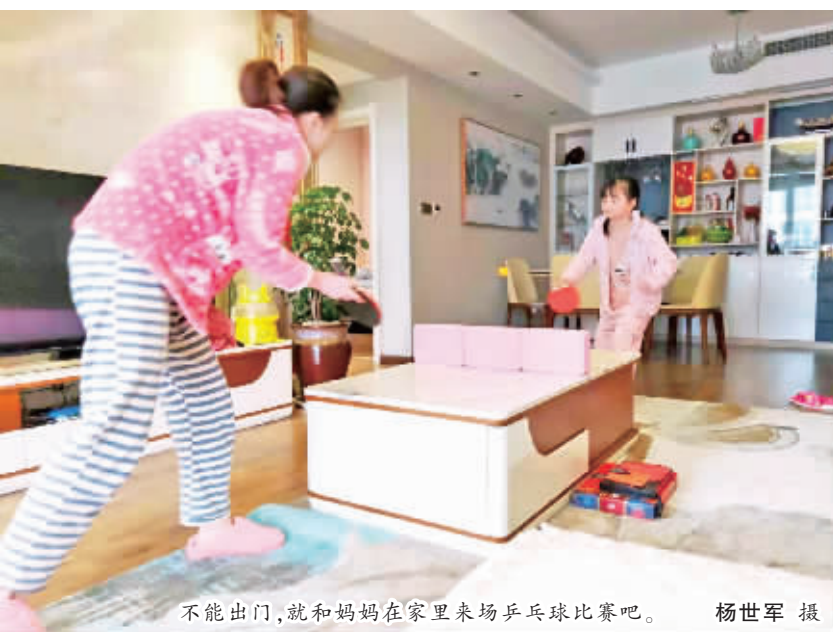
不能出门，就和妈妈在家里来场乒乓球比赛吧。

本报讯(通讯员 袁晓强)自新型冠状病毒感染的肺炎疫情影响发生以来，宁陕县住建局高度重视，积极开展疫情防控，全面加强工作人员安全防护、道路清扫保洁、设施日常管理和消杀工作以及垃圾清运等工作，确保顺利打赢疫情防控阻击战。 该局及时成立新型冠状病毒感染的肺炎疫情防控工作领导小组，印发《关于做好住建领域新型冠状病毒感染的肺炎疫情防控工作的通知》，夯实防控工作的单位责任、企业责任和个人责任，做到守土有责、守土负责、守土尽责。通过张贴、发放宣传单及推送短信、微信等方式，加大对疫情防控政策及防控知识的宣传和健康教育力度，全面提升防控形势的复杂性、严峻性的认识，全面克服作业人员和管理人员“疫情和我无关”“疫情恐慌”思想。同时全面加强城区环境卫生整治，购置充足的消毒液和消杀药剂，着力加强重点区域消毒消杀和病媒生物孳生地治理。此外，该局全方位督促5家房地产开发、8家建筑施工、6家物业服务企业密切关注工作人员身体健康状况，特别是湖北籍返乡职工、春节期间在外旅居或同湖北旅居人员接触的职工相关信息。遇有突发情况或出现疑似病例的情形，坚持实事求是，及时报告、妥善处置，以及时全面客观地报送信息质量推动防控工作的早发现、早报告、早隔离、早处置，保障人民群众的身心健康和生命安全。