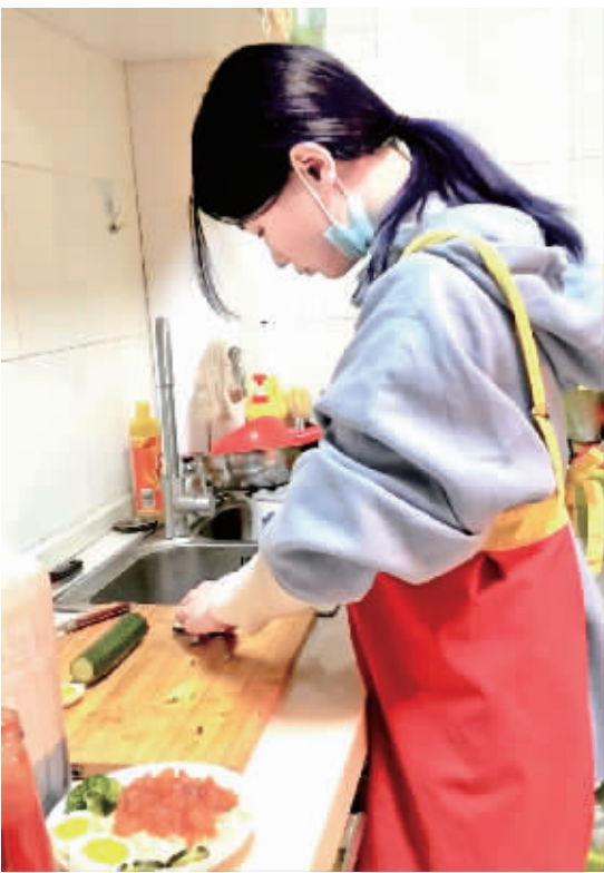
为减轻紧张、焦虑情绪，大学生学做家务。