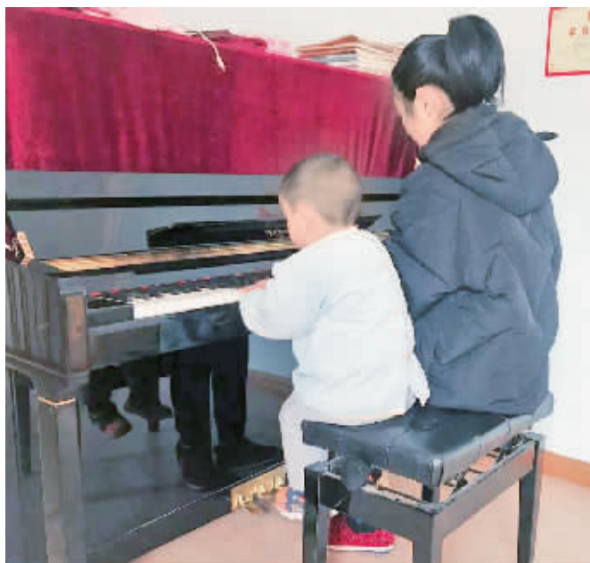
疫情防控期间，旬阳县宅在家的琴童临时当起了弟弟的钢琴老师。