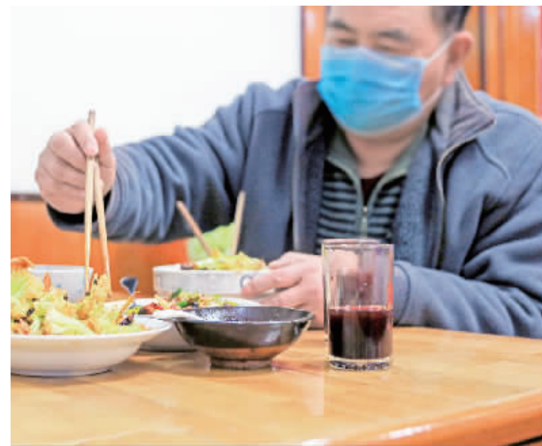
目前，大家自觉在家隔离，吃饭分餐制，一人一个空间。说话和吃饭夹菜时都戴上口罩。