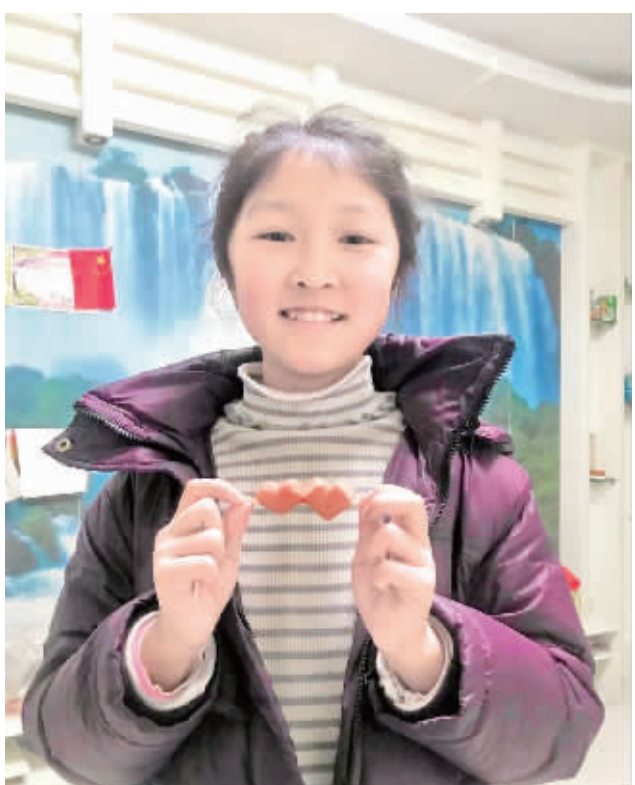
疫情肆虐，宅在家的女儿创意一对爱心为武汉加油！