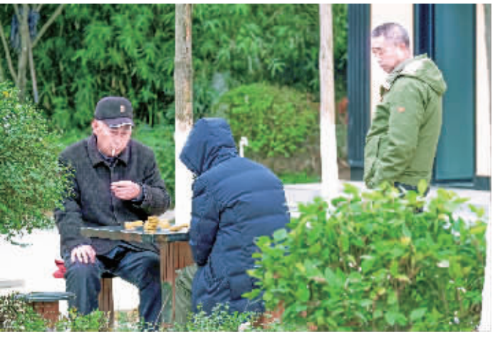
还是依然有“无畏者”不戴口罩。