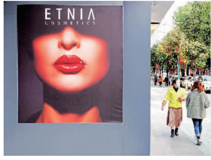
紫阳县城广告牌旁严密防控的市民。