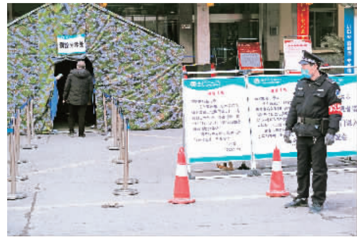
安康中心医院在大门口设立预检分诊处。