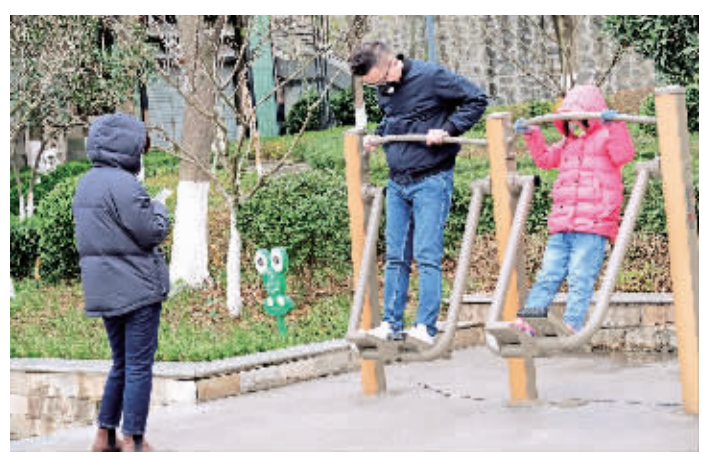
一家人在江北亲水广场锻炼。