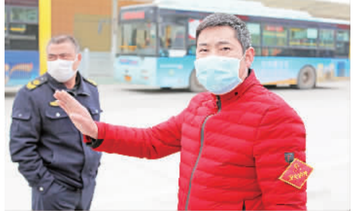
汉滨区运管所在火车站执勤的工作人员。