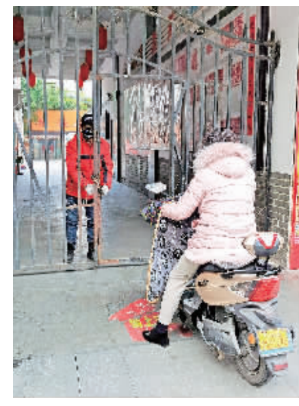
进入单位大门需要登记才开锁。