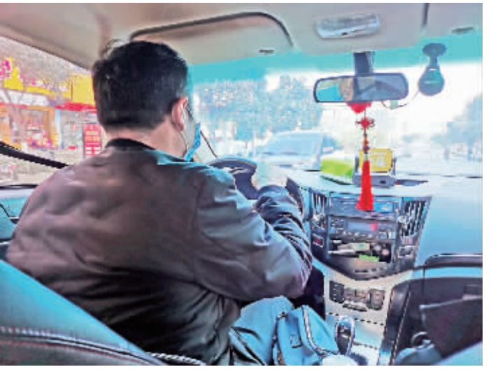
的哥说,今年出租车生意清淡,希望疫情早日被控制。