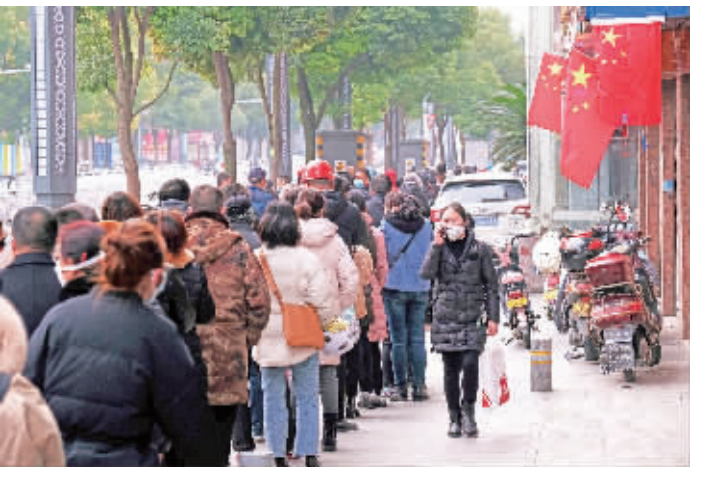
大年初一早晨,汉滨区解放路一药房外市民排起购买口罩的长队。

一场突如其来的疫情,让刚刚进入2020春节的人们始料不及。“口罩”一下子成了今年春节当之无愧的关键词。作者走上街头用镜头记录疫情下的安康市民。