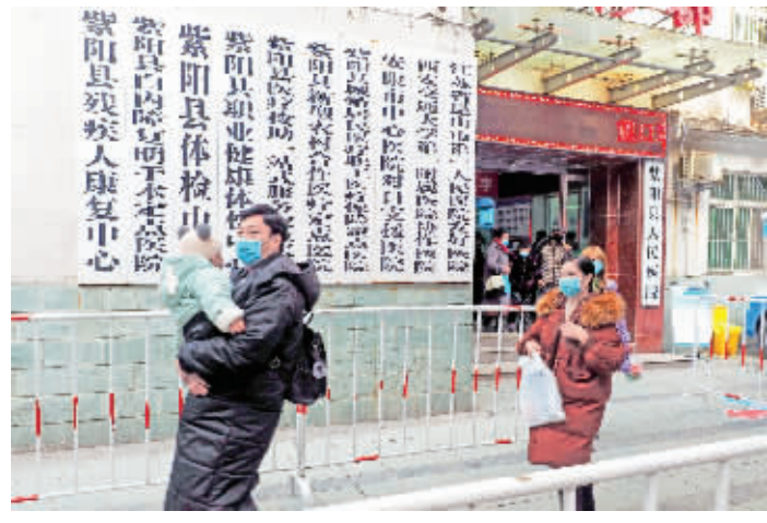
紫阳县医院预检分诊处市民通过预检。