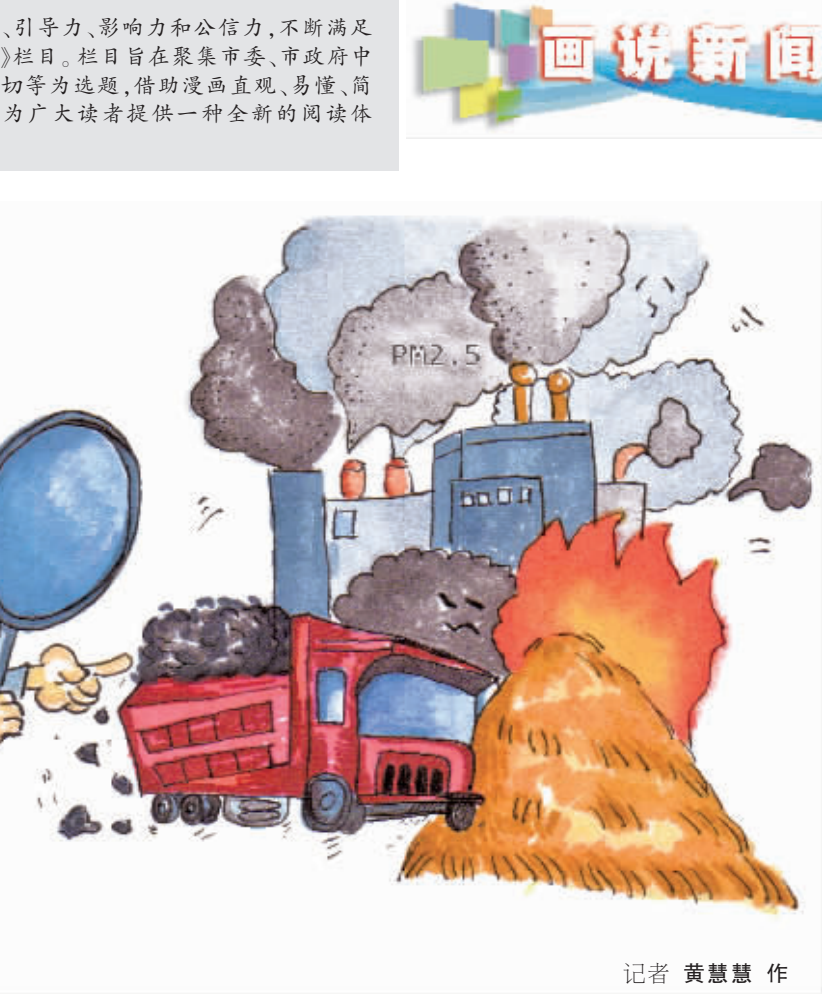
近年来，中省环保督查组相继在我市开展生态环境保护“回头看”。渣土车“跑冒滴漏”、秸秆焚烧、中小企业污染源、“散乱污”企业、油烟餐饮污染问题等环境污染现象时有发生，督查组就相关问题对我市进行了交办并责令限期整改。