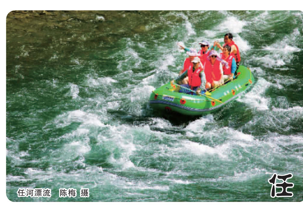
任河漂流 陈梅 摄