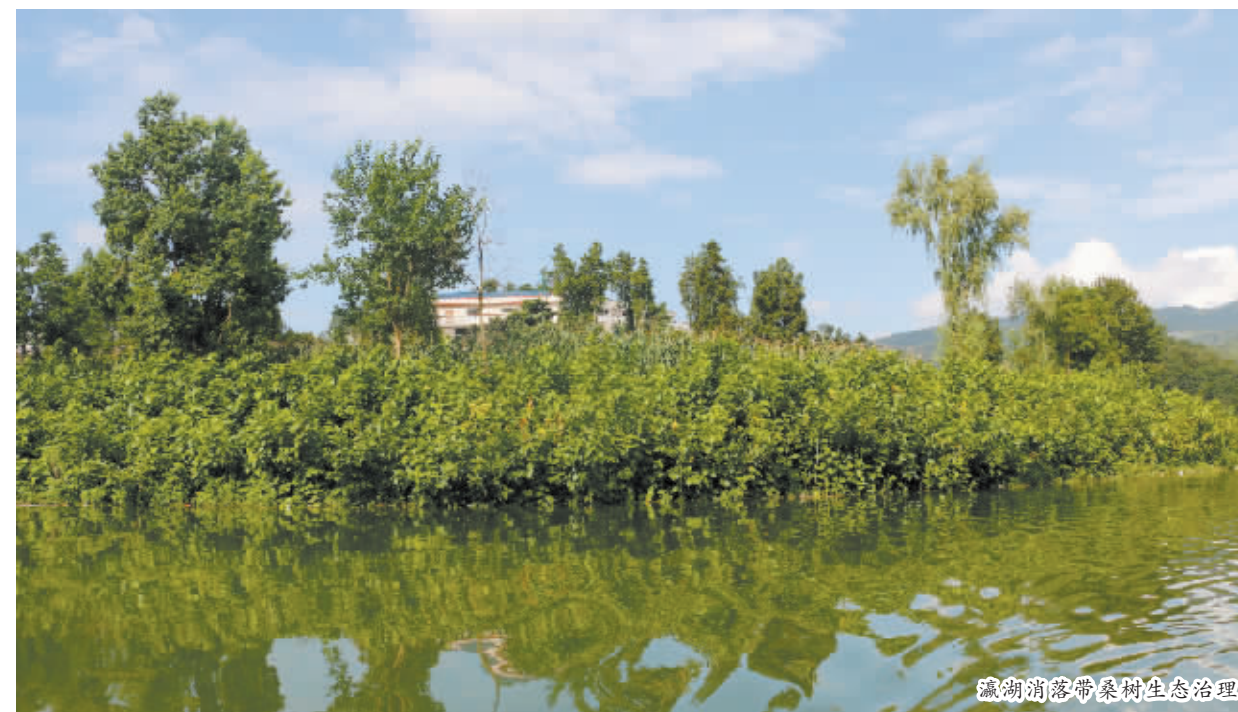
瀛湖消落带桑树生态治理