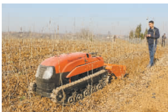
自动微耕机应用于桑园翻土