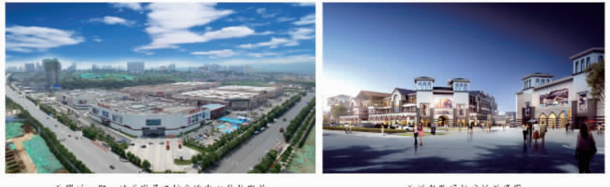
天贸城一期一期商家入驻签约仪式现场

在描绘城市商业繁荣的语境中，“首店经济”是一个最近两年新出现的词汇。它是指在零售、餐饮等实体行业里，具有代表性的品牌或新的品牌首次进驻某一城市或区域，并由此形成的轰动或带动效应。“首店”被视为挖掘消费潜力，激发市场活力、塑造创新动力和品牌影响力的重要创新手段。本次招商发布会也引进了一众安康乃至陕西地区的“首店”与消费者见面，这其中包括：蔻驰（COACH）、C.N.C、太平洋咖啡、蜜酒等等。