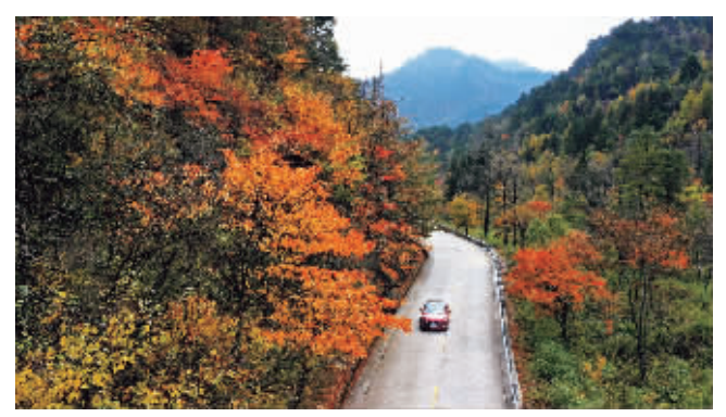
平河梁景区秋色