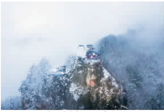
观音山莲花寺