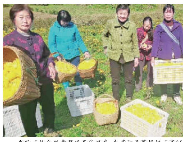
当前正值金丝黄菊盛开采摘季,在紫阳县蒿坪镇王家河村,万亩菊花成为一道亮丽的风景,菊花采摘也成为增加农民收入的重要途径。

党建引领人才培养。坚持以学促培,通过内培+外训、主题教育等形式切实抓好党员队伍和企业人才队伍融合建设。党建引领管理升级。把党建工作与加强企业日常管理结合起来,通过开展党员先锋岗+党员志愿岗,开办杂志《正阳之光》、一对一帮扶、我向企业献一策、党群共建等形式,实现党的建设与企业发展的双赢格局。党建引领责任担当。通过扶贫+慈善事业+志愿服务等形式,以实际行动传递温暖。创办了白河县民富源种养农民专业合作社,与贫困户签订酒店回购订单,向贫困户收购农副产品金额达70余万元;提供各类就业岗位100余个;捐款、助学共计90万元;定期携物资看望孤寡老人、留守老人20余次。