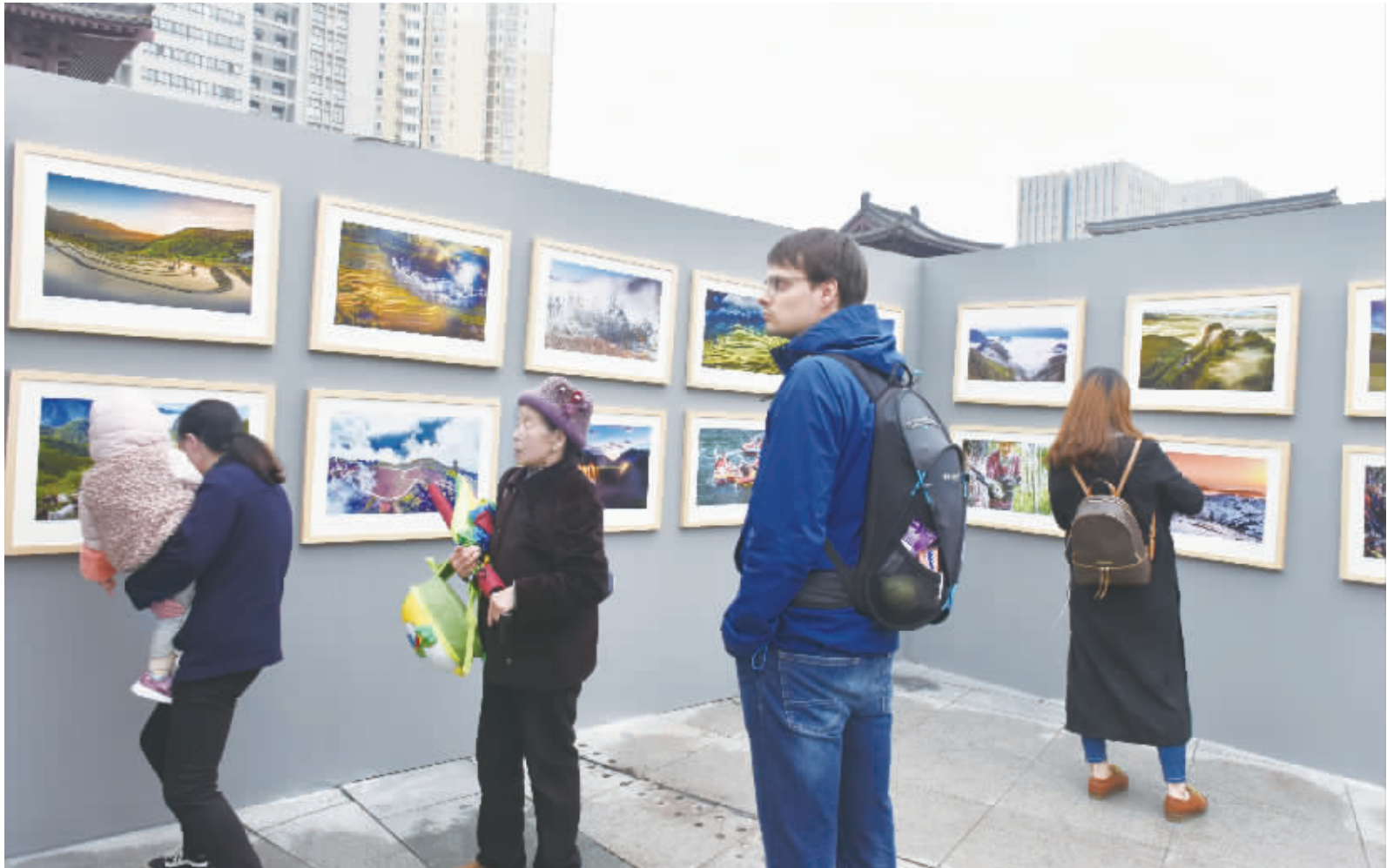
二月一日上午,陕西第四届国际丝路影像博览会暨西安国际摄影艺术节致敬劳动者大展在西安大唐西市广场开幕。岚皋县摄影协会《巴蜀摄影作品集》幅幅摄影作品入选参展,岚皋县摄影协会荣获优秀组织奖,这是本届影展我市唯一获奖单位。