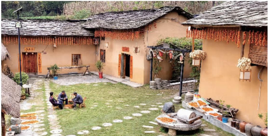
白河卡子镇陈家大院