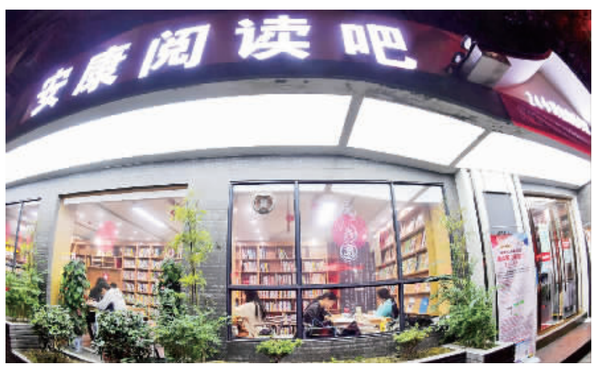
市民在安康阅读吧东大街分馆阅读图书。

近年来,秦巴山区的陕西省安康市在城市主干道、市民居住集中区、人流聚集区和学校周边开设了8处“24小时自助图书馆阅读吧”,打破了传统图书馆在服务空间、时间和借阅方式上的局限,通过自助借还、智能化服务,使上班族、学生、自由职业者等阅读群体,通过阅读吧享受到更加便捷的文化服务。据统计,目前走进阅读吧的读者累计超过45万人次。