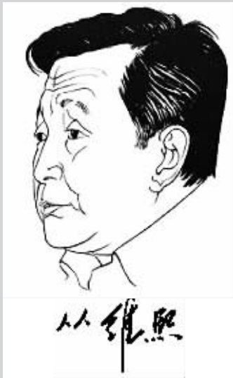
10月29日晨,中国当代著名作家从维熙在北京病逝,享年86岁。

从维熙,河北玉田人。1933年出生,曾任教师,北京日报记者、编辑。他16岁开始写作,在艺术上师法孙犁,1957年之前,曾出版了《七月雨》和《曙光升起的早晨》等作品,是“荷花淀派”的代表作家之一。遭遇政治坎坷和磨难二十多年,对监狱生活有较多的了解和体会。一九七九年他重返文坛之后,率先发表了《大墙下的红玉兰》等十几部描写劳改营生活的中篇小说,因而被文坛誉为“大墙文学”之父。著有中篇小说《大墙下的红玉兰》《远去的白帆》,长篇小说《北国草》,长篇纪实文学《走向混沌》,散文集《历史,从未这样》等。2018年1月《从维熙文集》(十四卷)出版,包括长篇小说卷5种,中短篇小说卷5种,纪实文学、散文卷4种,共540余万字。