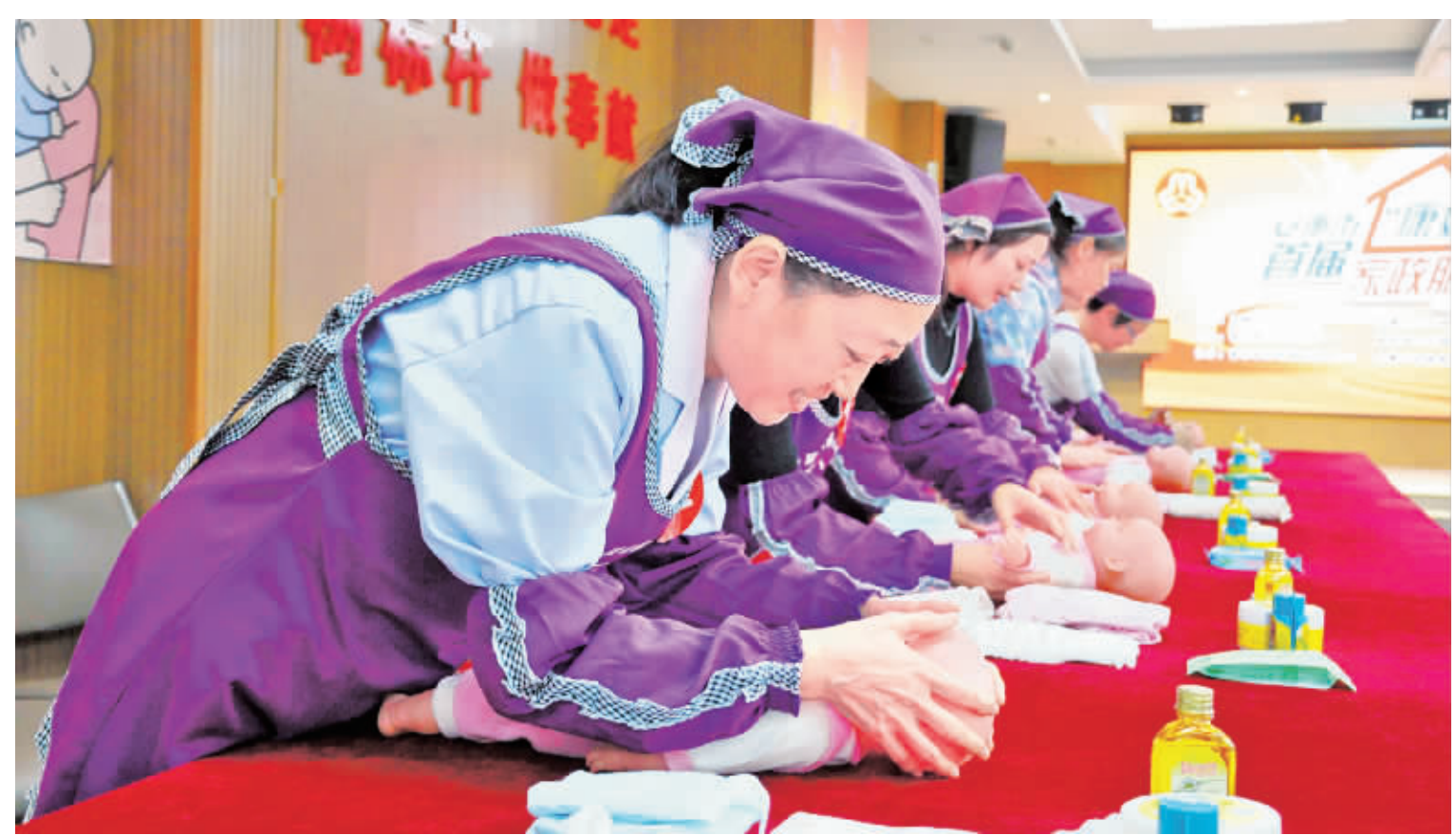
今年以来,紫阳县加大家政服务人员培训力度,通过家政服务人员带动贫困户走上脱贫快速路。