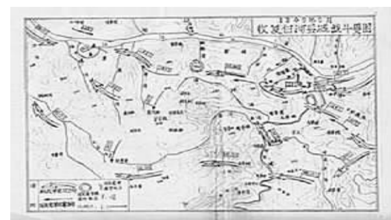
图一为解放军19军收复白河战斗示意图。

1949年5月24日,为完成“打到汉中去,解放全陕南,配合一野,消灭胡宗南”的作战任务。中国人民解放军第2野战军第19军(兼陕南军区,西进后归1野指挥)发起白(河)竹(溪)平(利)战役,首战白河。按“迂回夹击、全歼守敌”的作战方案,19军55师164团、165团、57师169团、171团以及白河独立营奉命参战。经2天激战,于5月25日上午,全歼国民党白河守军和地方法安武装2700余人,收复白河,开启了白河历史的新纪元。