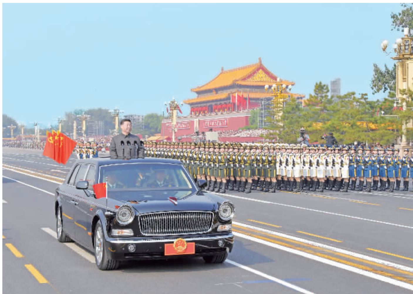
10月1日，庆祝中华人民共和国成立70周年大会在北京天安门广场隆重举行。中共中央总书记、国家主席、中央军委主席习近平发表重要讲话。