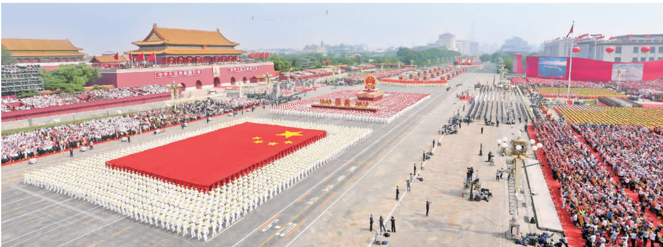
10月1日，庆祝中华人民共和国成立70周年大会在北京天安门广场隆重举行。