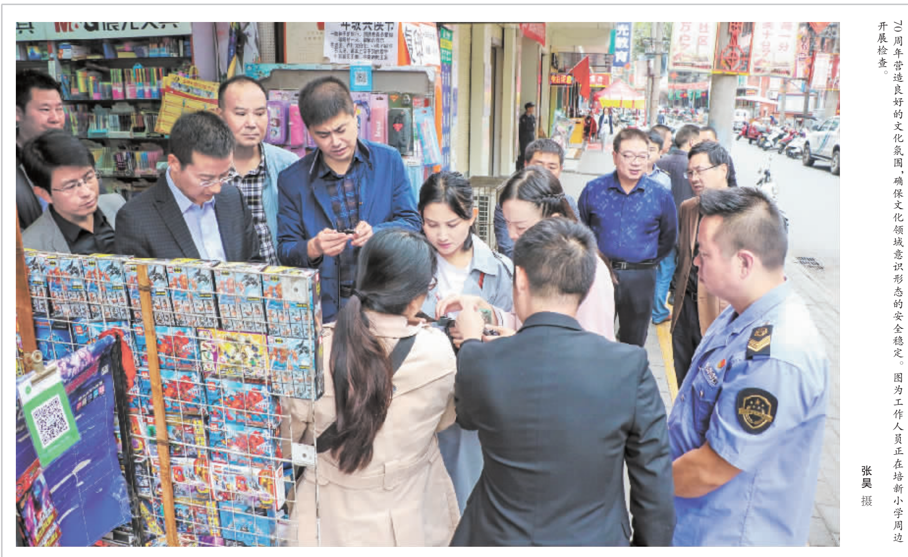
9月24日,汉滨区组织相关部门深入开展迎国庆“扫黄打非”集中整治行动,为庆祝新中国成立70周年营造良好的文化氛围,确保文化领域意识形态安全稳定。图为工作人员正在培新小学周边开展检查。