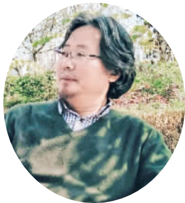
艺途孤旅,矢志不移