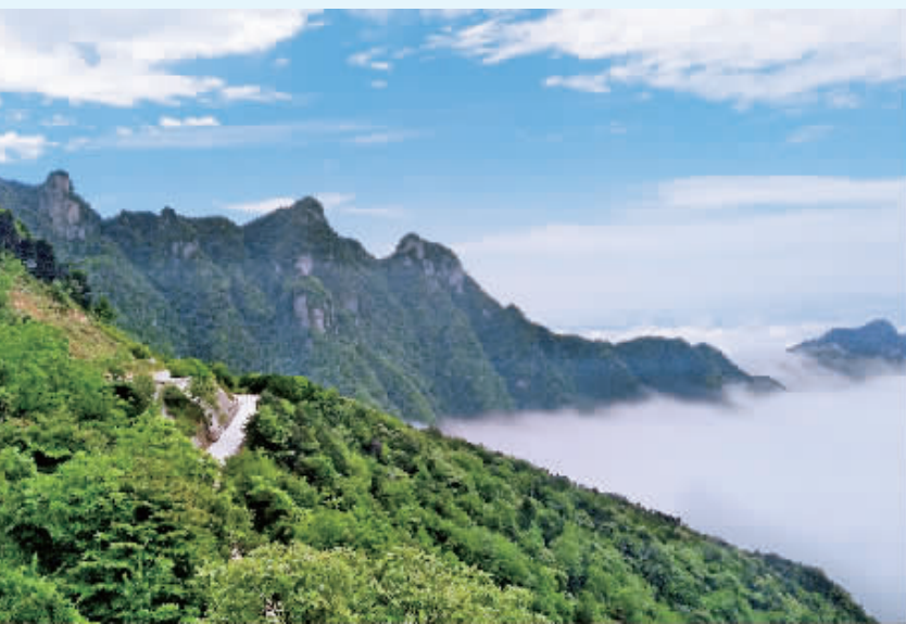
雾漫凤凰山