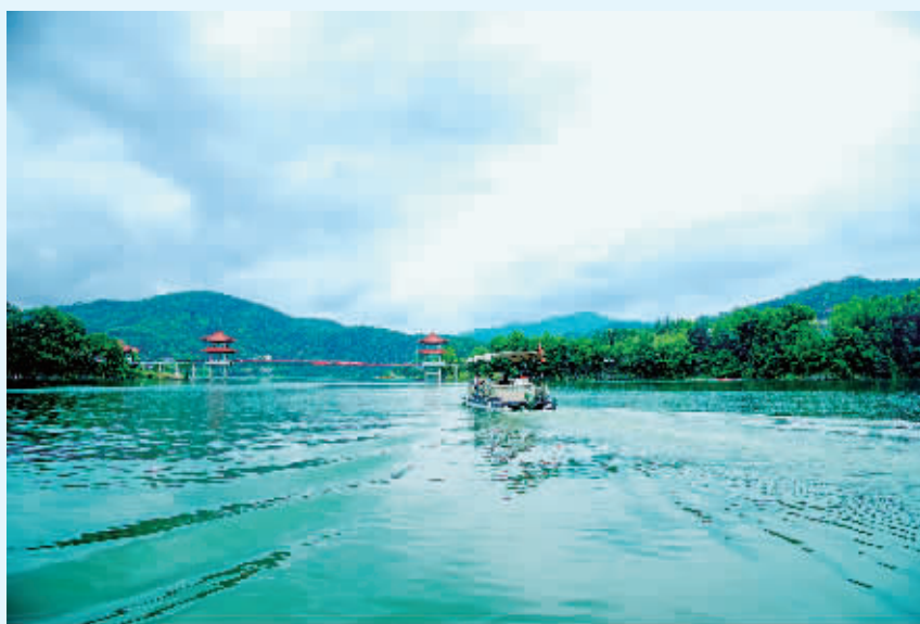
水光激浪映山乡

安康市水利局、《安康日报·汉江晨报》联合举办“生态安康·秀水之歌”摄影暨美文大赛,向社会各界征稿。参赛作品请发至1739108259@qq.com信箱,作者请发附件并留下联系电话和地址,否则稿件无法采用。如图片数量多,请压缩打包发送。谢谢合作! (策划:吴平 组稿:唐大明 卜一兵)