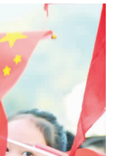
宁陕小学校园内,300余名师生齐聚一堂,举行“升国旗、唱国歌、我倡议”等爱旗护旗活动。新学期伊始,宁陕小学举办主题为“同铸少年梦,共谱爱国情”的开学典礼,培养引导学生热爱国旗,热爱祖国,争做新时代的接班人。