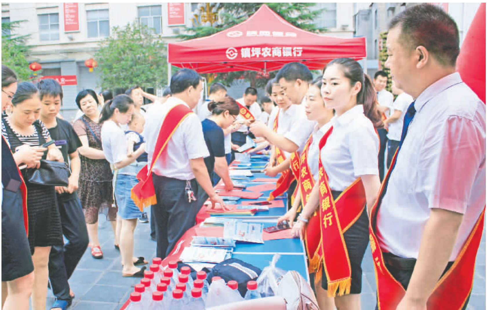
8月22日至23日，镇坪农商银行各网点在县政府广场集中开展为期两天的“秦·贷”线上贷款推介活动。徐长峰 袁震 摄

本报讯(通讯员 李步余 鲁盼)近日，旬阳县公安局交警大队执勤六中队在路查时查处一男子驾车，同时存在三种交通违法，驾驶证被一次性记27分。8月20日，甘溪执勤中队民警在白柳镇老龙沟村进行道路巡查时，拦停一辆普通的红色二轮摩托车。经检查发现田某饮酒后驾驶机动车，且该田没有摩托车驾驶证只申领过C1证，属于准驾不符。民警对其驾驶的摩托车牌照信息进行网上核查，发现该车检验至2017年3月31日，属于逾期未检验。报经交警大队决定对田某饮酒后驾驶与准驾车型不相符合的车辆、机动车未按规定进行安全技术检验的违法行为处驾驶证记27分，罚款1700元的处罚。据悉，持有机动车驾驶证的人员驾驶与准驾车型不符的车辆，其性质等同于无证驾驶，不但对道路交通安全造成潜在威胁，而且若发生交通事故，保险公司也是拒赔的。