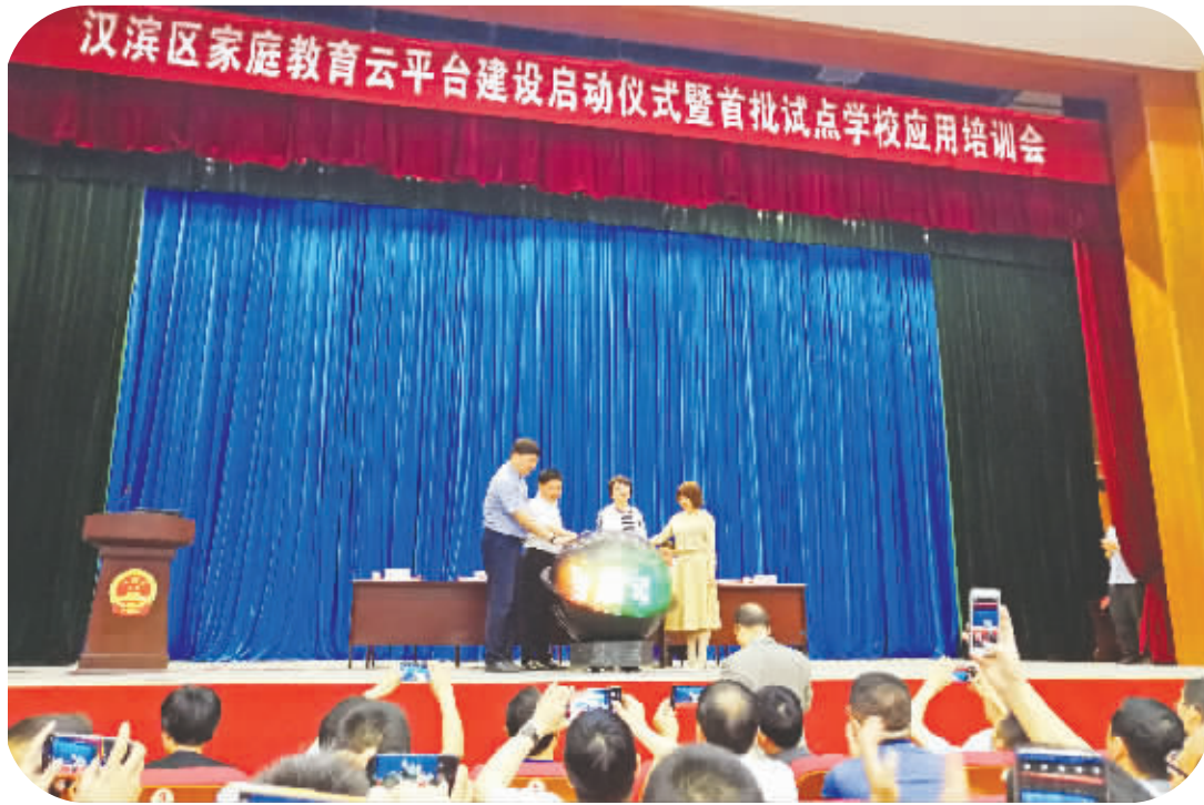
2019年5月28日，云平台启动仪式备受期待。

可以看出，在与知子花教育合作以前，汉滨区已经在家校共育的实践中走出了自己的一条路。而此番合作，应该是对家庭教育“社会化”实践的一次“升级”。这也成为各方尤其是学生家长有所期待之处。