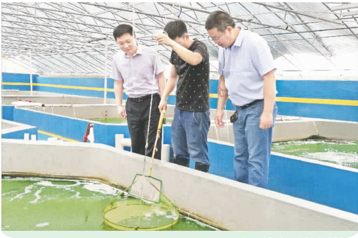
工厂化循环水养殖车间的南美白对虾长势喜人。

目前，壹加壹公司已建成 1000 平方米的工厂化循环水淡育苗及成虾生产标准车间，可为 4000 亩外塘提供淡化标粗苗种供应和技术支撑。