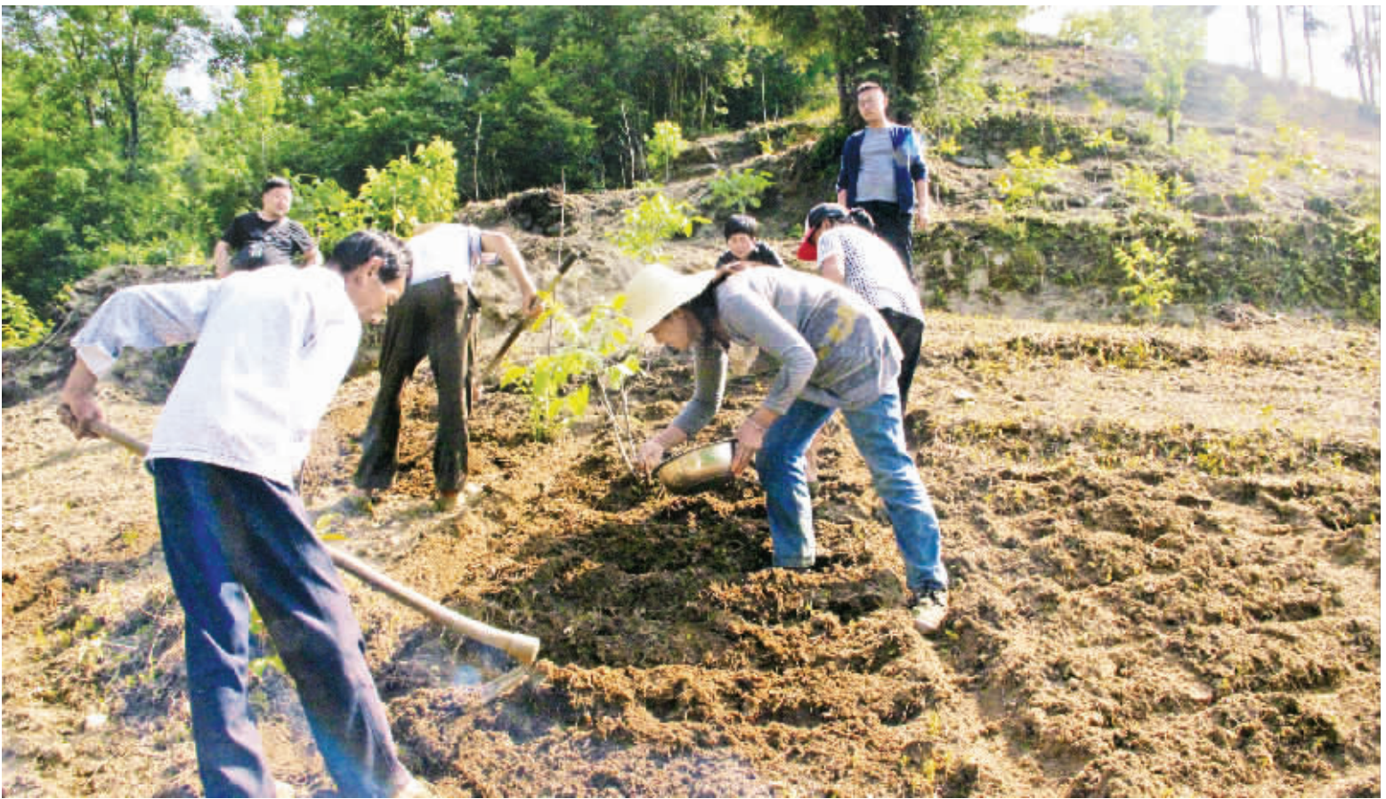
在石泉迎丰镇新庄村谭家堡二户贫困户正在山头整地、掏行、播撒桔梗、柴胡这两味中药材。结合市场需求,二户贫困户与迎丰镇镇林中药材合作社签订了200亩的“订单合同”。该镇药材种植有帮扶,技术指导有保障,药材销售有出路,为贫困户致富增收开出一剂“新药方”。

先、预防在先。通过官方网站、微信公众号、镇村公开栏等,广泛宣传“六个严禁”纪律规定、“六选八不选”人选条件等换届纪律知识,教育引导广大党员群众依法依规参与换届选举。县纪委制定印发《关于严肃换届工作纪律的通知》,进一步压实换届工作主体责任和监督责任,严明纪律要求,维护换届秩序。